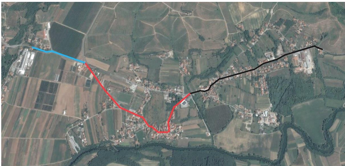
Slika 7: Kanalizacija Bilje - Orehovlje (— obstoječi kanal, — nov tlačni vod, — nov gravit. kanal)