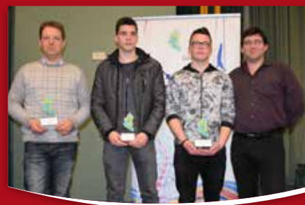
28 ŠPORT Najuspešnejši športniki in društva leta 2015 v Gimnastični zvezi Slovenije