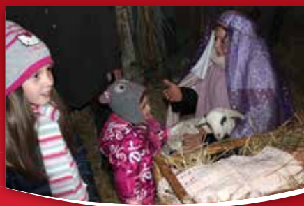
18 IZ KRAJEVNIH SKUPNOSTI Božič in žive jaslice na Vogrskem