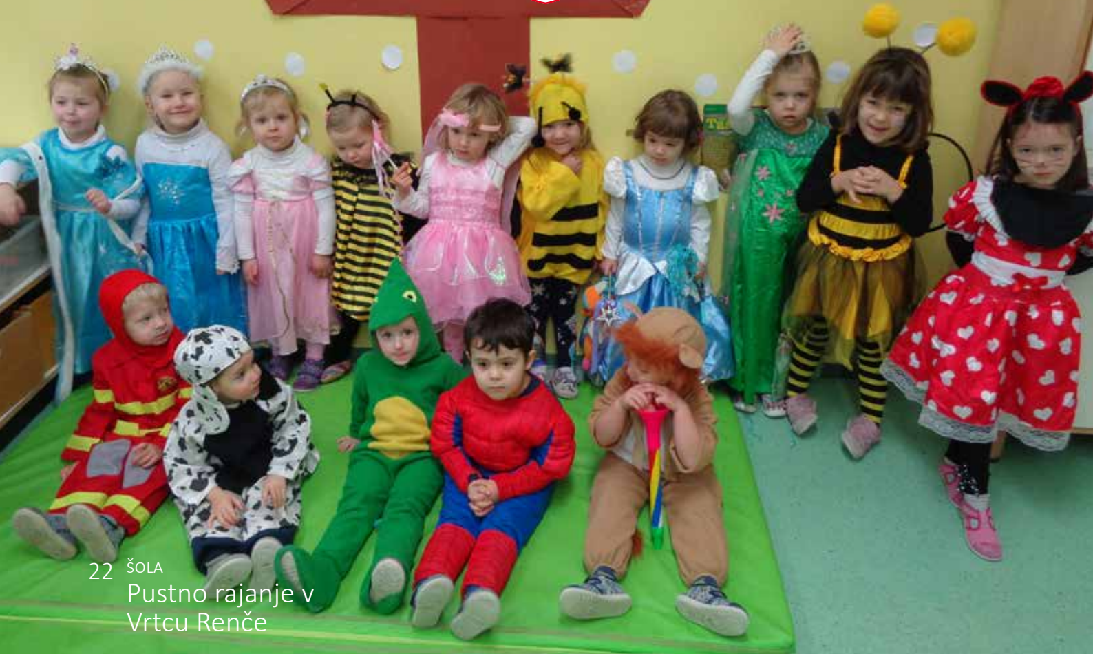
22 ŠOLA Pustno rajanje v Vrtcu Renče