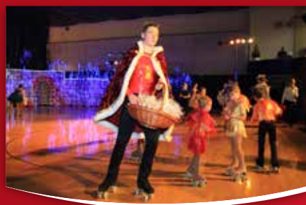
7 IZ KRAJEVNIH SKUPNOSTI Kotalkarji kotalkarskega kluba iz Renč letos ponovno uprizorili božično-novoletno kotalkarsko revijo »Mali princ«