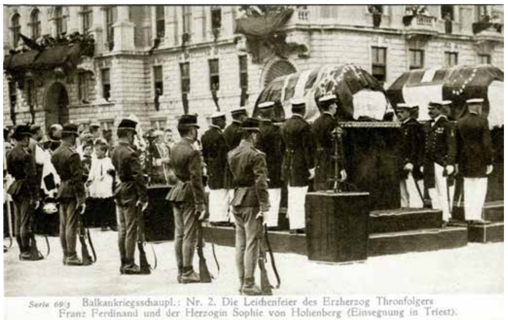
Serie 69/5 Balkankriegsschaupl.: Nr. 2. Die Leichenfeier des Erzherzog Thronfolgers Franz Ferdinand und der Herzogin Sophie von Hohenberg (Einssegnung in Triest).