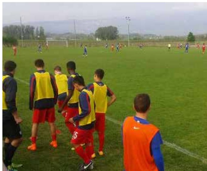
Utrinek iz tekme Hrvaška - ZDA

Z zaključkom šolskega leta se delo v ND Renče ne zaključuje. Za tiste nogometne navdušence, ki nogometno žogo spretno vrtijo med nogami in imajo radi nogomet, bodo poskrbeli tudi na nogometnem kampu. Celodnevni nogometni kamp pod vodstvom trenerja Zorana Trivunovića se bo odvijal v Renčah in bo potekal v dveh terminih, in sicer: od 20. do