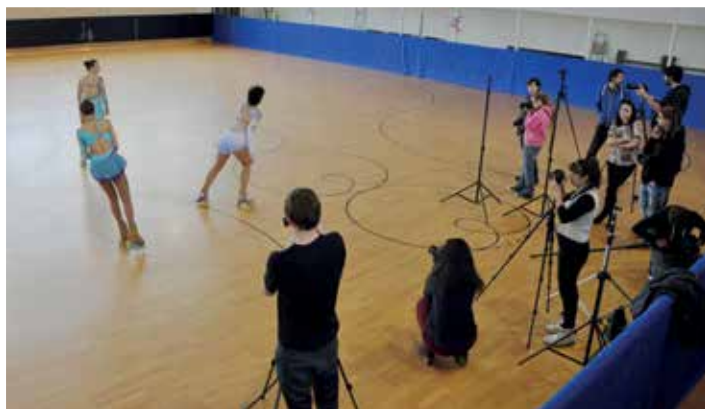
Ogrevanje, tako za kotalkarice kot fotografe