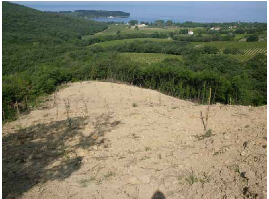
Izvedena krčitev gozda v kmetijske namene na območju Kolombana v Slovenski Istri

Odločbo o krčitvi gozda v kmetijske namene izda ZGS na pobudo lastnika gozda, kar pomeni, da mora lastnik za izdano odločbo v skladu z Zakonom o upravnih taksah (Uradni list RS, št. 42/07–UPB3, 126/07 in 88/10) plačati upravno takso v višini 4,54 EUR za vlogo in 18,12 EUR za odločbo, kar skupaj znese 22,66 EUR. Poleg plačila upravne takse je lastnik dolžan plačati tudi stroške postopka, ki predstavljajo