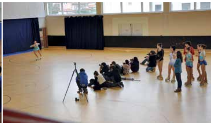
Sedaj pa zares