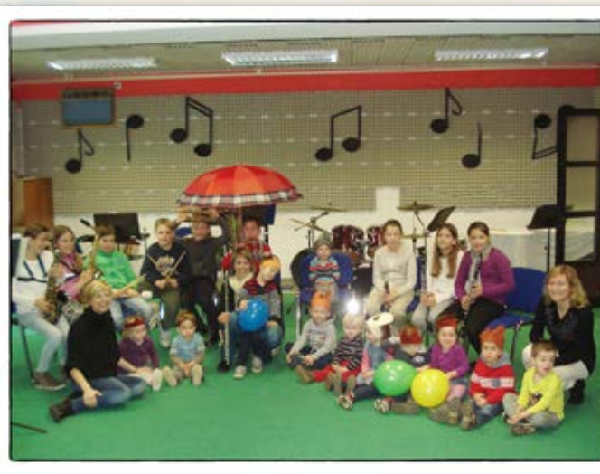
• Obisk godbeniške šole •