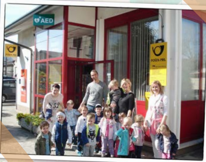
• Obisk pošte •