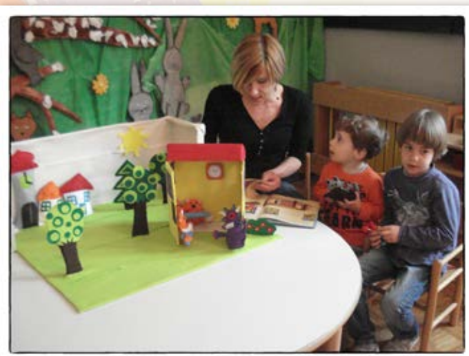
• Lutkovna predstava •