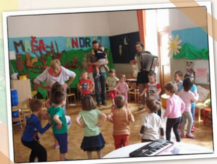
• Plesno dopoldne •