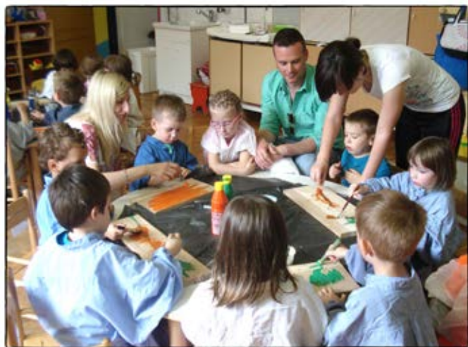
• Umetniška ustvarjalnica •