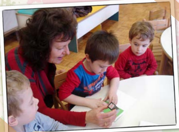
• Sodelovanje z rdečim križem Vogrsko •