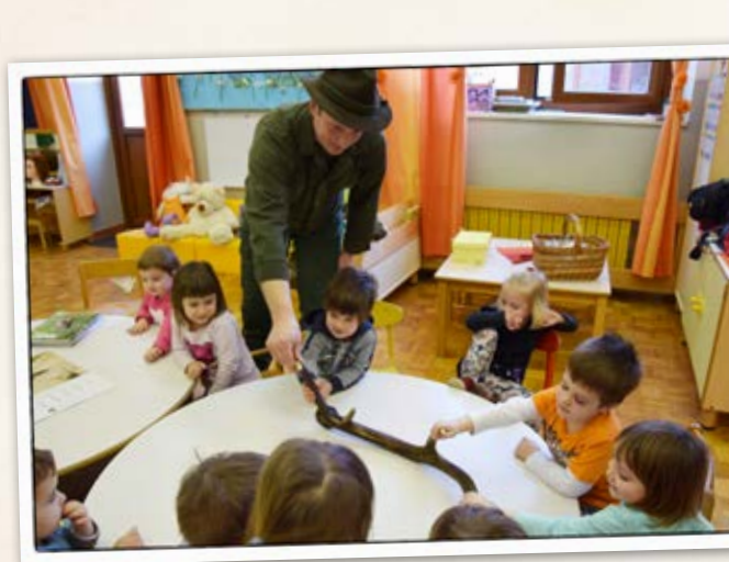
• Lovec na obisku •