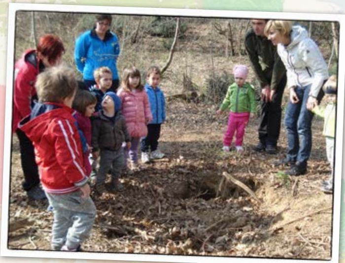
• Pohod na Jazbine •