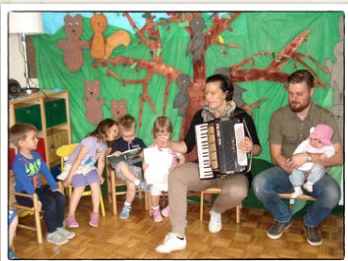
• Glasbeno doživetje •