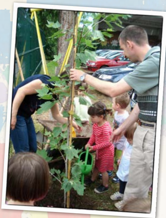
• Sajenje drevesa •