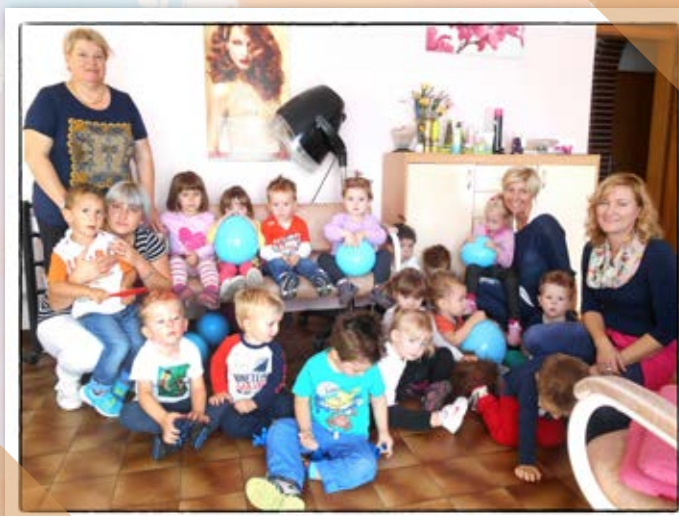
• Na obisku v frizerskem salonu •