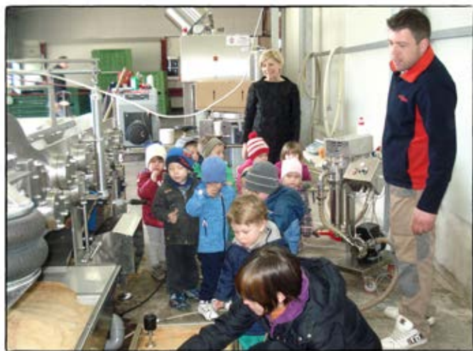
• Obisk domačije Smodin •