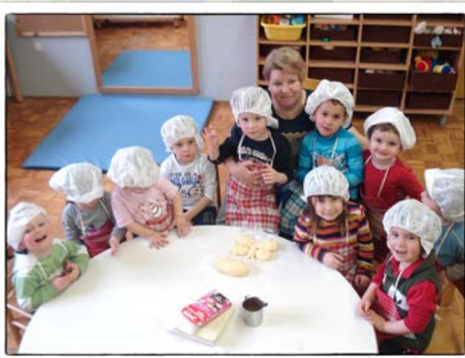
• Pekarna •