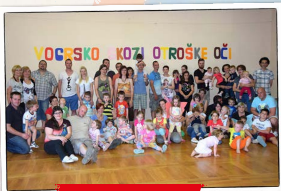
• Družabno srečanje •

V šolskem letu 2014/15 smo se v kombinirani skupini 2–4–letnih otrok »METULJČKI« prijaviли na projekt TURIZEM IN VRTEC na temo »Z igro do prvih turističnih korakov«. Projekta smo se lotili sistematično in vanj vključili sodelovanje družin. Z vsako družino smo ob praznovanju otrokovega rojstnega dne skupaj načrtovali dejavnost, ki nas je spodbudila k raziskovanju oz. spoznavanju domačega kraja. Tako smo Vogrsko dobro spoznali, izpeljali kar nekaj obiskov in sodelovali z različnimi društvi. Projekt smo v celoti zaključili z otvoritvijo razstave 26. avgusta v okviru sredinih glasbenih večerov. Skozi fotografije vam predstavljamo naše celoletno delo na projektu. Pokukajte v svet našega raziskovanja: