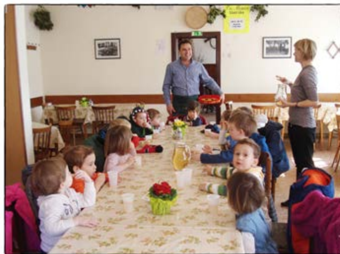
• Na obisku osmice "Pri Mimici" •