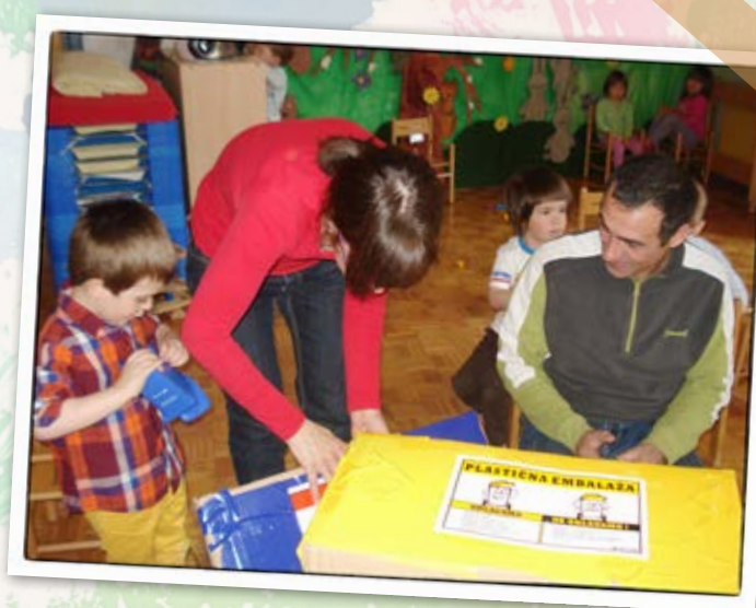
• Ločevanje odpadkov •

Projekt turizem in vrtec nas je vse skupaj popeljal na pot raziskovanja, druženja in prepletanja medsebojnih vezi, ki so nujno potrebne za dobro sodelovanje med vrtcem in družino. Z zaupanjem, ki smo si ga ustvarili, se je ustvarila tudi prijetna energija, ki se je samo še množila. Za nami je naša skupna pot. Brez vaše podpore, zaupanja in pozitivne energije ta pot ne bi bila zabavna in prisrčna. Iskrena vam hvala za vse vaše brezpogojno sodelovanje z nama in vašimi sončki.