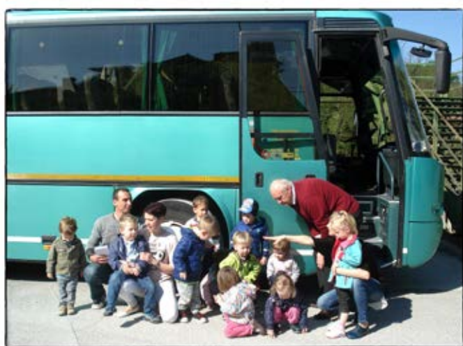
• Prva vožnja z avtobusom na Volčjo Drago •