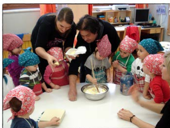
• Praznična pekarna •