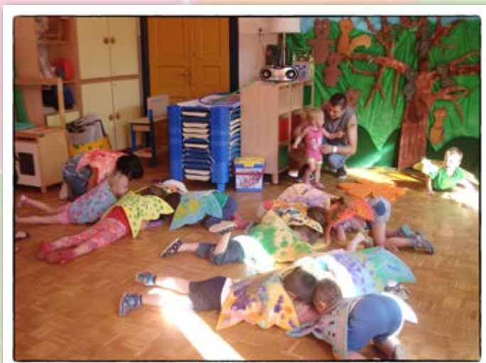
• Ples metuljev •