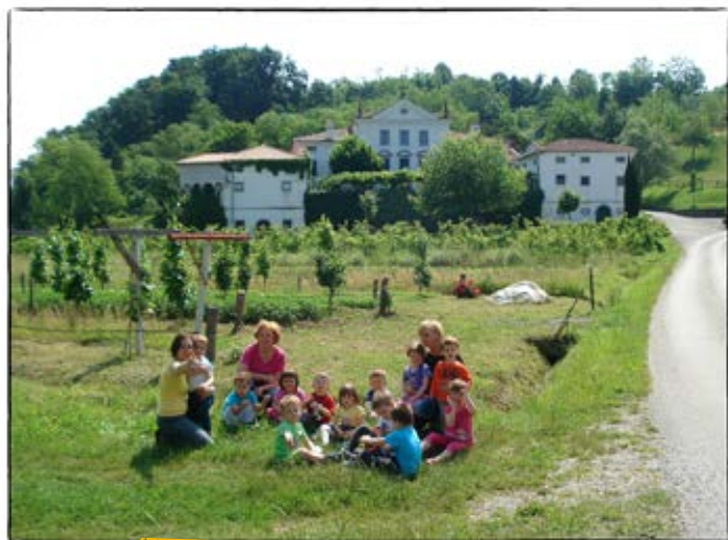
• Sprehod do dvorca Vogrsko •