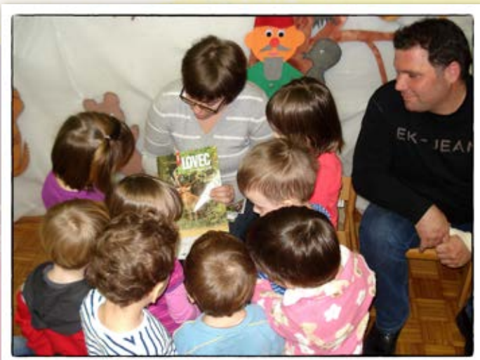
• Pogovor o živalih na Vogrskem •