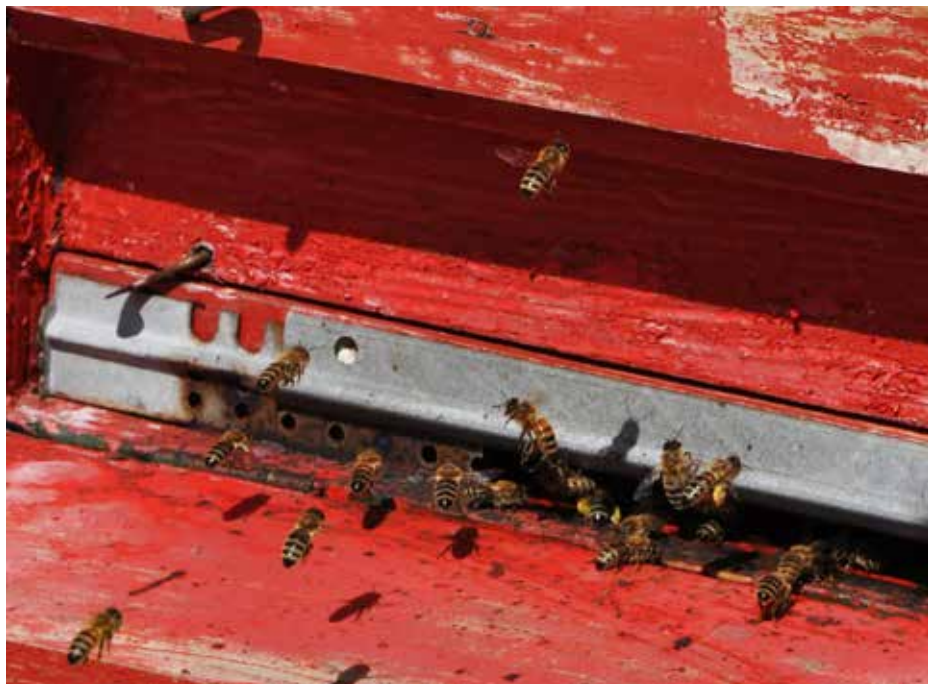
Ne uničujemo delavk, ki nam nabirajo med in oprashašejo naše rastline.

Ja, med njimi tudi za čebele. V zadnjih letih se je veliko govorilo o tem in še vedno je v razpravi, da naj bi bili ti insekticidi eden od pomembnih povzročiteljev množičnega