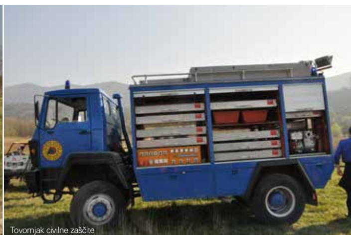
Tovornjak civilne zaščite