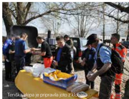
Teniška ekipa je pripravila joto z klobaso

CZ občine Renče – Vogrsko sodeluje z drugimi CZ in Regijskim štabom CZ za severno Primorsko. V okviru tega sodelovanja je bil organiziran Dan civilne zaščite, ki ga vsako leto organizira druga občina v naši regiji. Glavni namen pohoda je druženje pripadni-