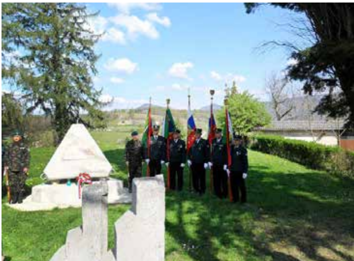
Počastitev spominskega obeležja