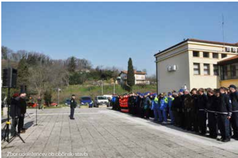
Zbor udeležencev ob občinski stavbi