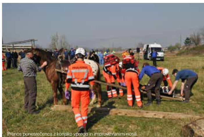
Prenos ponesrečenca z konjsko vprego in improviziranimi nosili

V petek, 14. marca, smo se zbrali na ploščadi pred občinsko stavbo, kjer smo pozdravili in evidentirali udeležence. Poleg članov štaba in naših ekip, ekipe gasilcev iz Šempetra in članov DPD Soča, so se pohoda udeležili še predstavniki CZ iz občin MO Nova Gorica, Šempeter-Vrtojba, Miren-Kostanjevica, Brda, Kanal, Vipava, Bovec in Kobarid, medobčinsko redarstvo, predstavniki CZ iz Starancana (It) in Gorice (It) ter predstavniki teritorialnega polka slovenske vojske. Članice krajevnih odborov Rdečega križa in Karitas naše občine so skupaj z OŠ Renče pripravili zajtrk. Z domačim pecivom, čajem in svežo kavo so poskrbeli, da na pot nismo odšli lačni in žejni. Po slovenski himni in postroju vseh udeležencev sta zbrane poz-