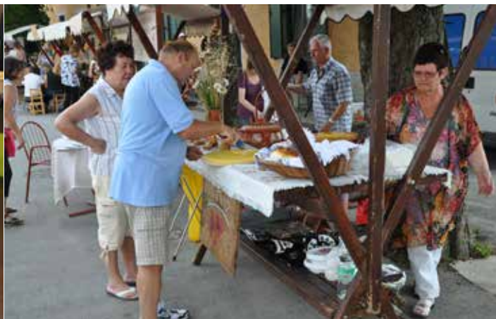
Mohorjevo v Renčah

koncertu so se predstavili učenci, ki glasbena znanja nabirajo v Glasbeni šoli Nova Gorica in Godbeniški šoli Vogrsko ter že prekaljeni mladi mojstri, ki igrajo v različnih priložnostnih sestavih.