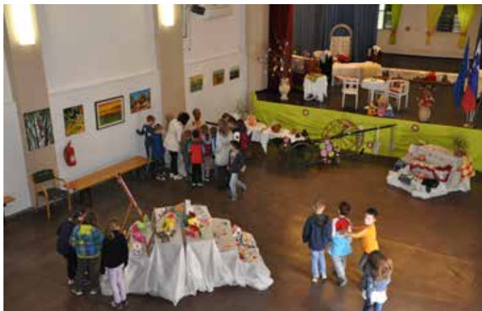
Razstava Kultura od vrat do vrat