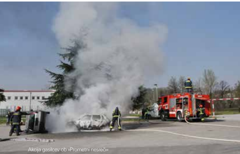
Akcija gasilcev ob »Prometni nesreči«