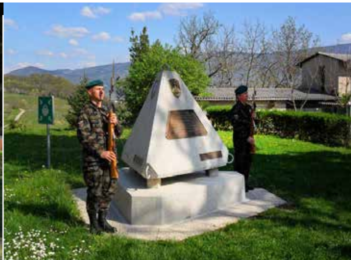
Častna straža pri spominskem obeležju

► prebivalci Vogrskega pred 23 leti pokončno stali v enotah za obrambo domovine Slovenije, ne glede na posledice, ki bi lahko prizadele njih same ali njihove družine. Poudaril je, da Območno združenje veteranov vojne za Slovenijo »Veteran« Nova Gorica in Občina Renče – Vogrsko številna tajna skladišča orožja in streliva na Vogrskem in drugih krajih naše občine z veliko ponosa obeležujeta s spominskimi ploščami; v letu 2011 sta bili slavnostno odkriti spominski