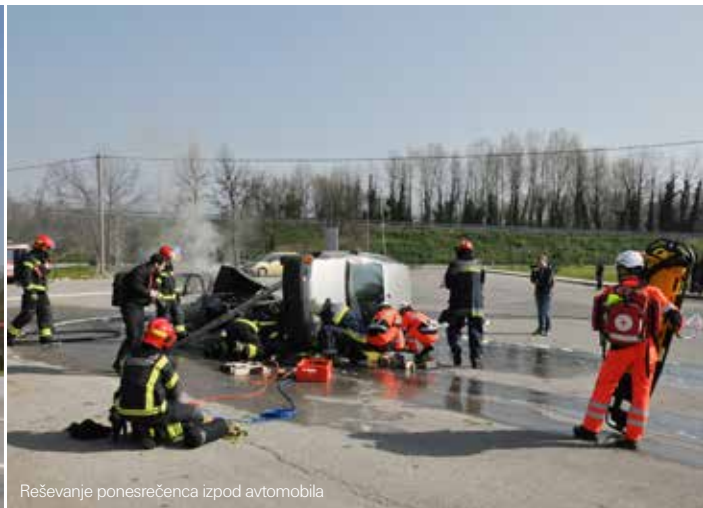
Reševanje ponesrečenca izpod avtomobila

dravila Rajko Lasič , poveljnik CZ in Aleš Bucik , župan občine Renče – Vogrsko.