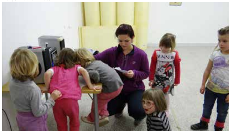
Plesne urice z Amelo