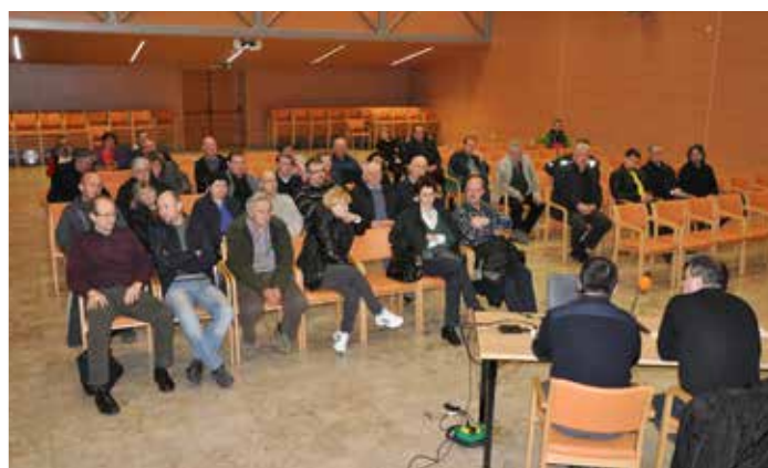
Med udeleženci posveta je bilo kar nekaj takih, ki so jih nepridipravi že obiskali

Na srečanju oziroma okrogli mizi, ki se je odvijala na temo »Vlomi v stanovanja oz. hiše«, se nas je zbralo kar precej zainteresiranih, da se na tem segmentu nekaj premakne. Sprejeli smo sklep, da naj bi ozave-