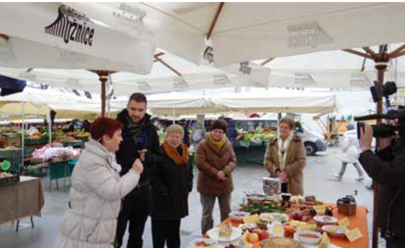
Na ljubljanski tržnici