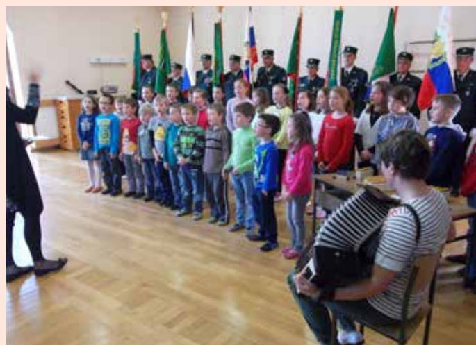
Učenci POŠ Vogrsko