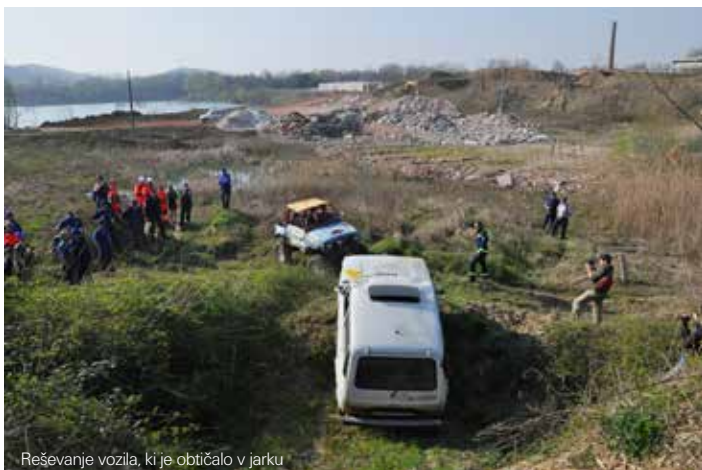
Reševanje vozila, ki je obtičalo v jarku