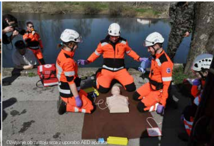
Oživljanje ob zastoju srca z uporabo AED aparata