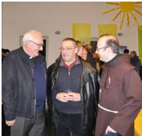
Po prireditvi še prijeten klepet