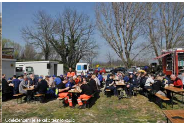
Udeležencem je še kako teknilo kosilo