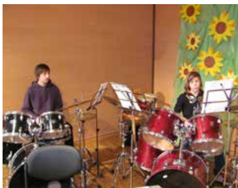
Vasja in Filip