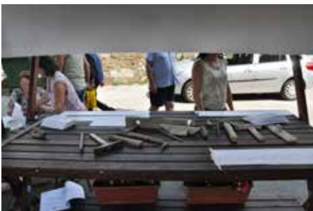
Zbiranje starega orodja in delovnih pripomočkov