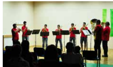
Pihalna zasedba Vogrsko

vinarji razvajali s ponudbo svojih domačih vin. Glasba, druženje, prijetno okolje - vse to nas je prepričalo, da velja Glasbeno poletje na Vogrskem naslednje leto ponoviti.