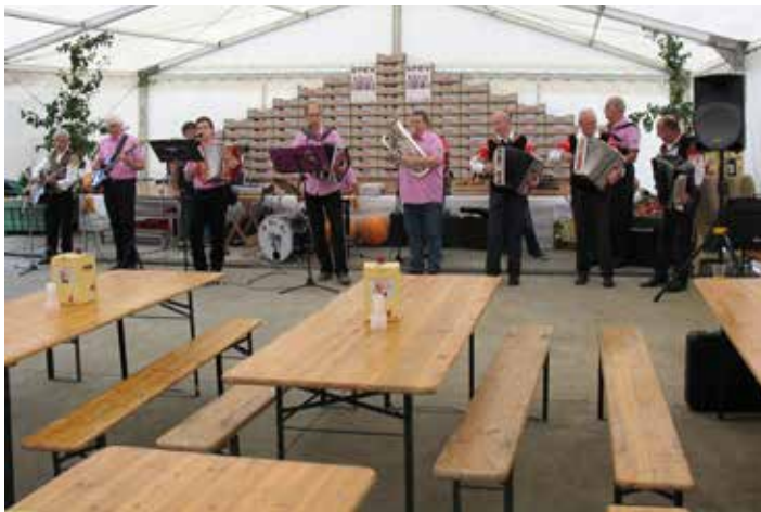
Ansambel Vesele harmonike