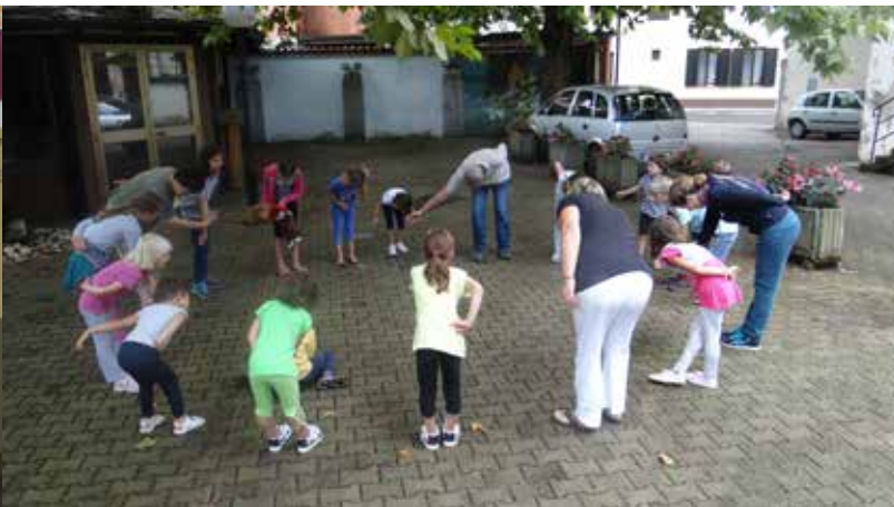
Sur le pont..