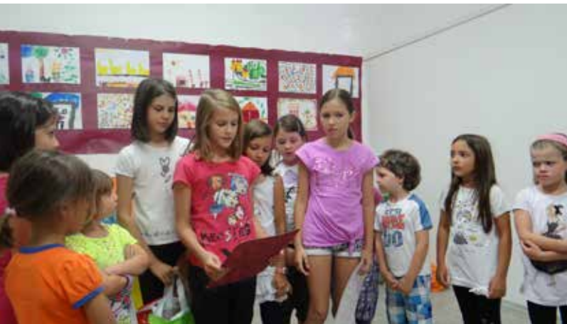
slovo od Živ-Žava