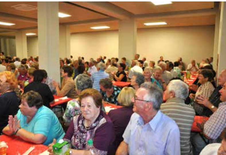
številska udeležba na srečanju.