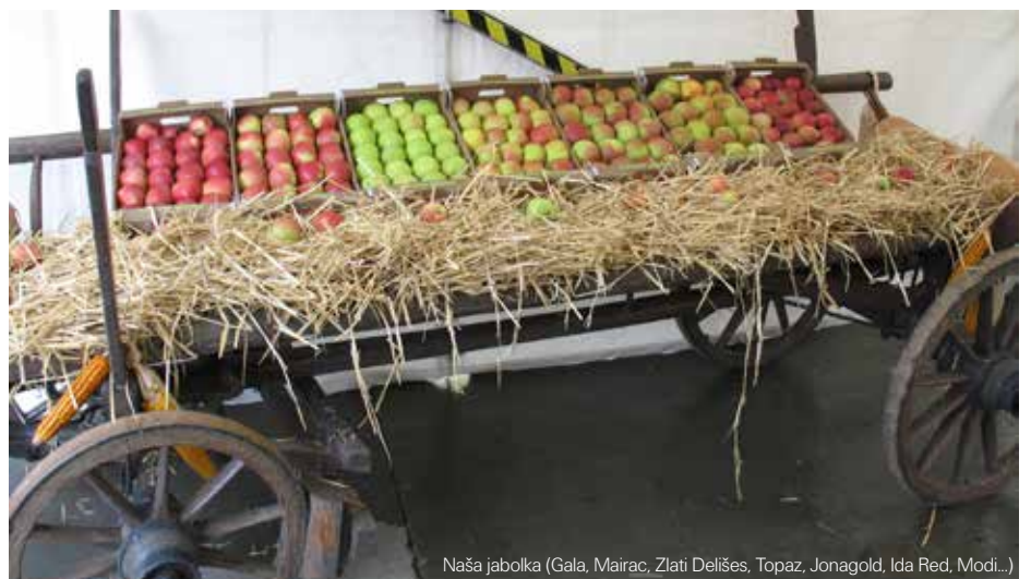
Naša jabolka (Gala, Mairac, Zlati Delišes, Topaz, Jonagold, Ida Red, Modi...)

V soboto, 13. septembra, se je kljub slabi vremenski napovedi prebudil krasen sončen in topel dan, ki je privabil številne mlade družine, starejše in druge obiskovalce na našo kmetijo. Obiskovalce smo popeljali skozi zgodbo o pridelavi jabolk in nastajanju sadnih sokov.