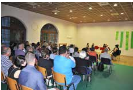
Dobro obiskana prireditev

Na otvoritvenem, Klavirskem večeru, smo lahko prisluhnili glasbenim improvizacijam