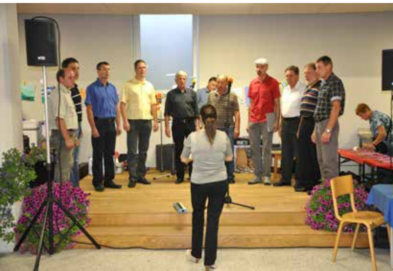
MoPZ 1883 Lijak Vogrsko