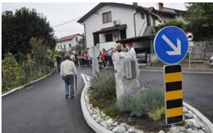
Lepo urejeno križišče v Britofu