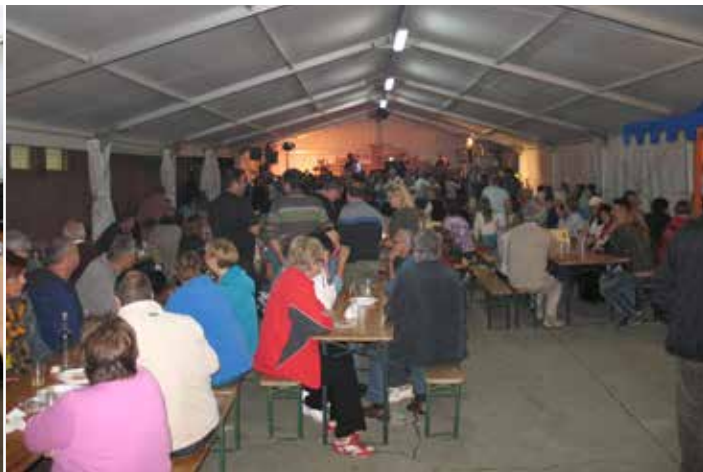
Zabava z Ansablom Spev

► Dan se je na naši kmetiji pričel že zgodaj, z odprtjem trgovine in degustacijo jabolk, sokov ter jabolčne pite. Radovednim obiskovalcem smo predstavili prostore, od sortirnice do skladiščenja jabolk v naše hladilnice. Prava zanimivost za obiskovalce pa je bila predstavitev predelovalnice sadja, saj prič-