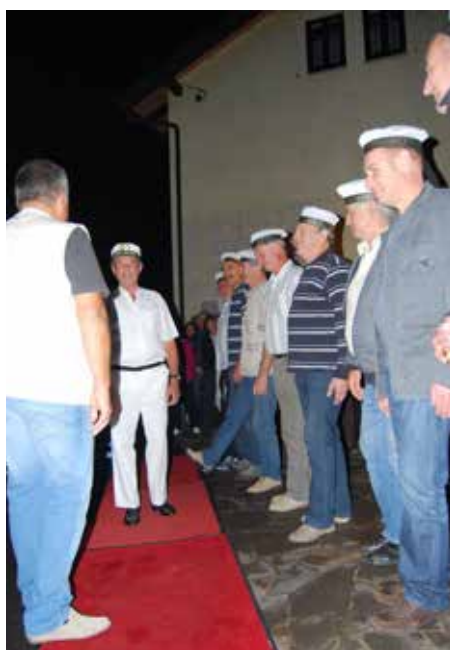
Kulturni program, pregled mornariške enote