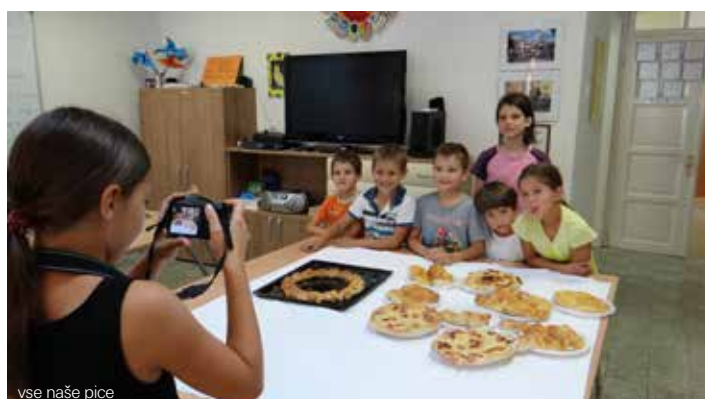
vse naše pice

je skupna vrednost opravljenega neplačanega prostovoljskega dela 4.740 EUR). Izvajalci programa smo se sestali že junija, skupaj oblikovali raznolik okvirni program glede na svoja znanja, veščine in talente ter opredelili urnik sodelovanja. Tako so se vsak dan zvrstile vnaprej pripravljene skupinske vodene dejavnosti (ustvarjalne delavnice), sprostitvene gibalne aktivnosti in igra z vrstniki po lastni izbiri.