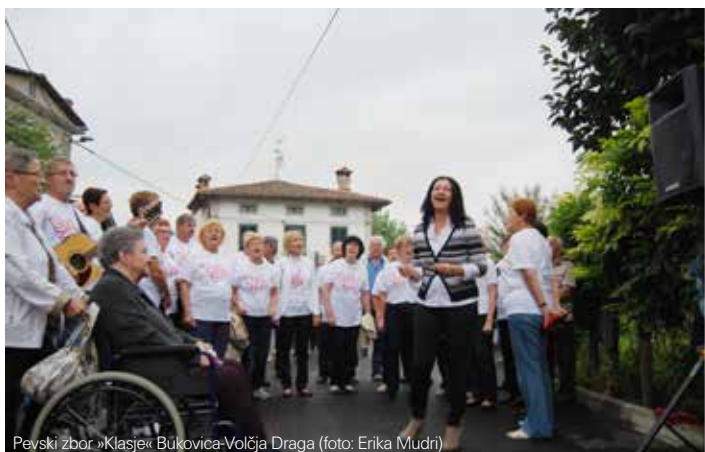
Pevski zbor »Klasje« Bukovica-Volčja Draga