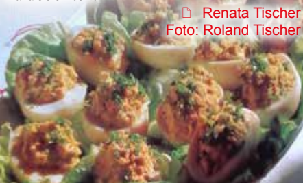
Renata Tischer