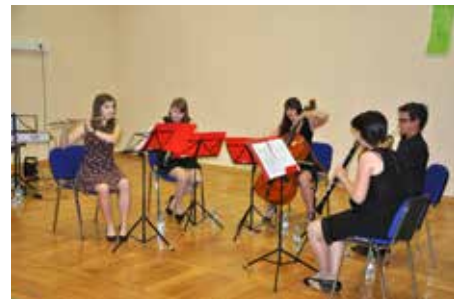
Pihalna zasedba NOVArt

S tem kratkim koncertnim ciklom smo glasbeno dogajanje, ki je sicer zasidrano v Bukovici, ponesli na Vogrsko. Atrij OŠ Vogrsko namreč nudi prekrasen ambient za takšno poletno druženje. Žal nam suho vreme ni stalo ob strani in smo vse koncerte izvedli v večnamenski dvorani pri šoli. Smo pa atrij zato izkoristili za druženje pred in po koncertih in se prepustili, da so nas lokalni