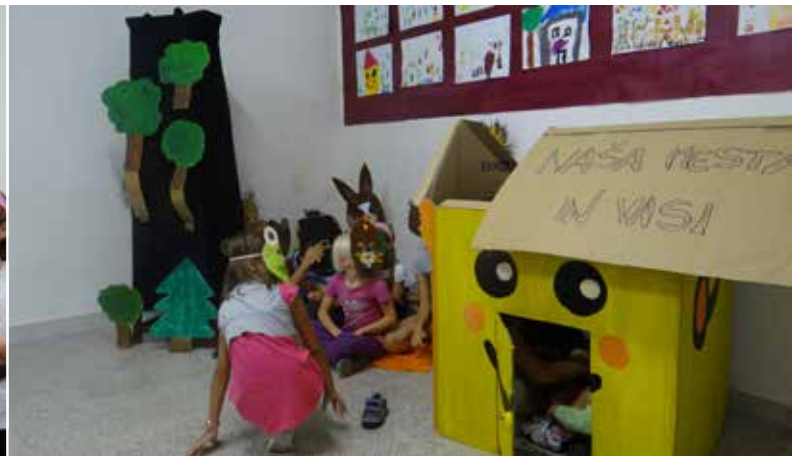
živalce iz Kuštrovega