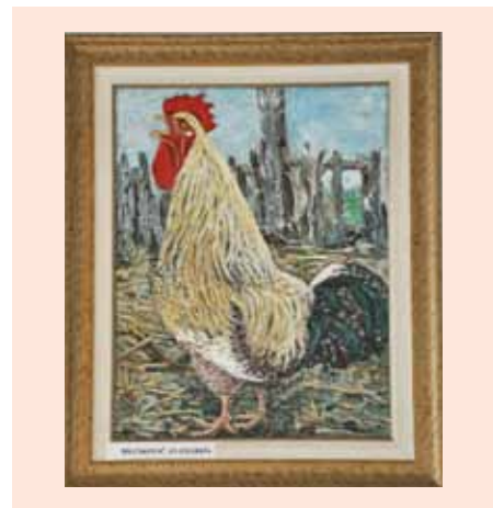
Avtor Anamarija Brankovič

Razstava likovnih del je nastala na pobudo članov upravnega odbora društva upokojencev. V avli kulturnega doma v Bukovici so