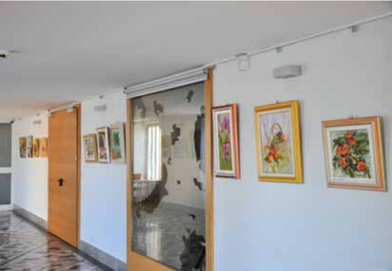
Razstavljena dela v hodniku ob dvorani