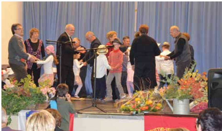
Polka z metlo