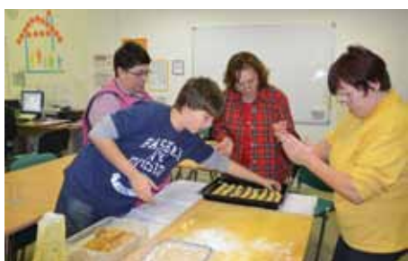
Priprava za peko

Vse bolj številna in generacijsko pisana skupina klekljaric je medse sprejela prvega moškega člana, fanta, ki mu kar dobro gre prepletanje niti med bucikami. Pripravili so izbor zanimivih izdelkov, mladih začetnikov in mojstric ter jih razstavili teden dni v Hiši, nato pa še v krajevnem razstavnem prostoru in tako obogatili razstavo slikark iz Renč in okolice.