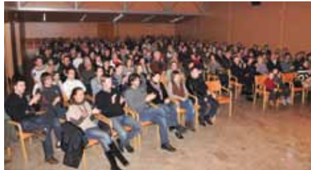
Bučen aplavz zadovoljne publike, nagrada nastopajočim

Plakati so vabili na koncert Kvazi godalnega kvarteta Podokničarji v malo dvorano Kulturnega doma Zorana Mušiča, ki pa je bila že po nekaj dneh razprodana in se je zato koncert preselil v veliko dvorano, ki je bila nekaj minut pred začetkom prav tako razprodana. Vsi gledalci smo vedeli, da je pred nami gotovo zabaven in dobre glasbe poln večer, vendar mislim, da nihče ni pričakoval, da si bo že med koncertom brisal solze – smeha, da ne bo pomote. Vendar tudi Podokničarji niso vedeli, kaj vse jim bo prinesel večer ... Že med tretjo skladbo je namreč violinistu počila struna! Ampak, ker fantje obvladajo svoj posel je vse skupaj zgledalo odlično zaigrano,