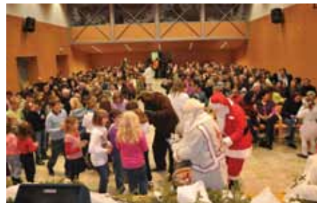
Božiček in Dedek mrz sta skupno obdarila nastopajoče učence