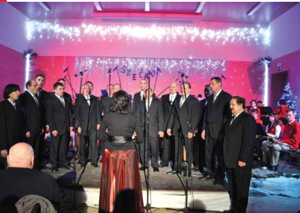
Vogrsko in Moški pevski zbor Lijak 1883 Vogrsko