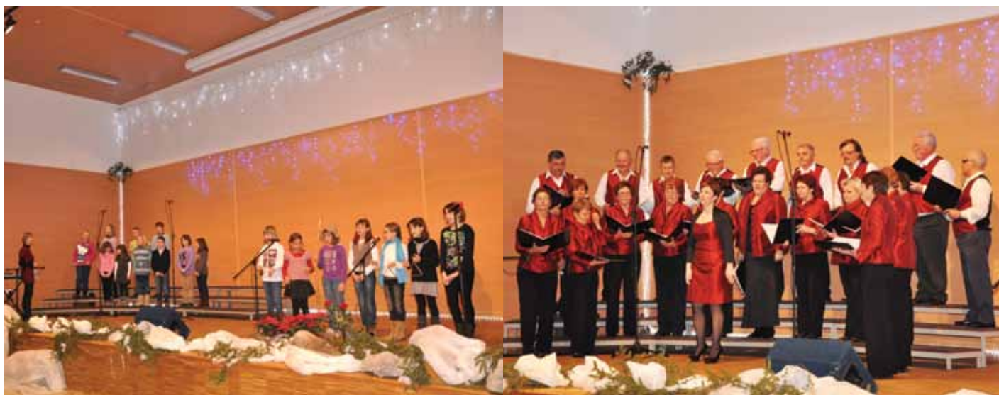
Nastop učencev POŠ Bukovica