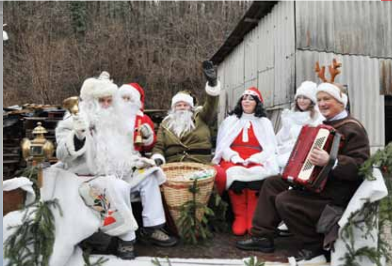
Obhod Dedka mraza in Božička po zaselkih

Mesec december je že ponavadi veseli mesec, poln raznih dogodkov in srečanj.