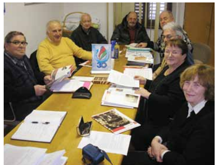
Delovna skupina za pripravo 35-letnice pobratena.