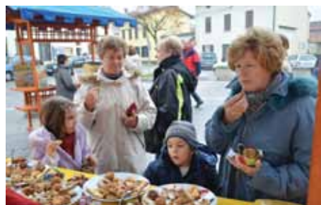
Zares so dobri

Ljubitelji vrtnic so se na potopisnem predavanju prepustili vodenju po rožnih vrtovih Francije in preizkusili čudežni džem iz vrtničnih cvetnih listov domače pridelave.