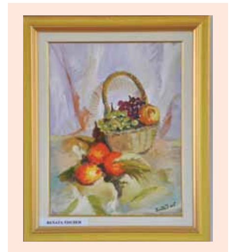
Avtor Renata Tischer

Izraža naše značaje, osebne zgodbe in sprejemanje sveta takšnega, kakršen je.