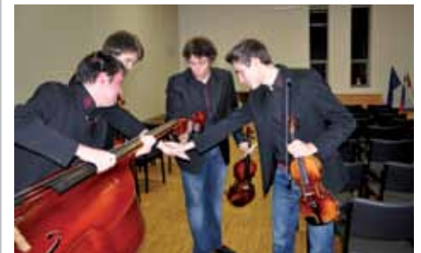
Ogrevanje pred nastopom

saj so naslednjo skladbo odigrali brez njega, potem pa se jim je – z novo struno, seveda – znova pridružil tudi violinist in koncert se je nadaljeval. Čeprav so bile vse skladbe izve-