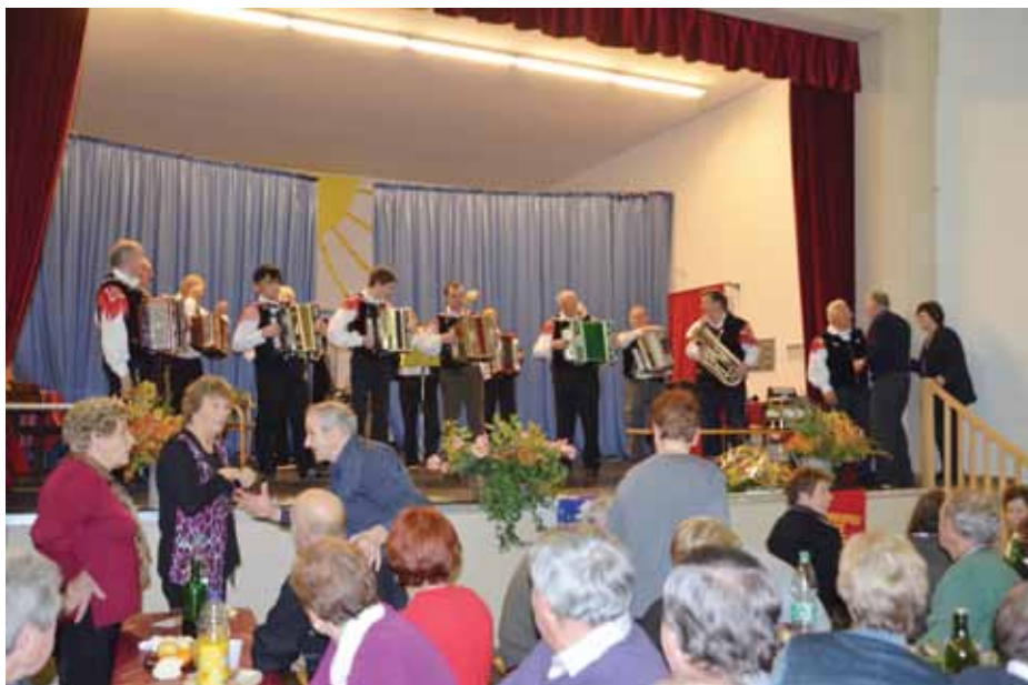
Be Es As so pravi za

Zadnje nedeljo v novembru je bila renška kulturna dvorana polna do zadnjega kotička. Na tradicionalno prednovoletno srečanje »Podajmo si roke« je prišlo skoraj polovica članic in članov Društva upokojencev Renče.