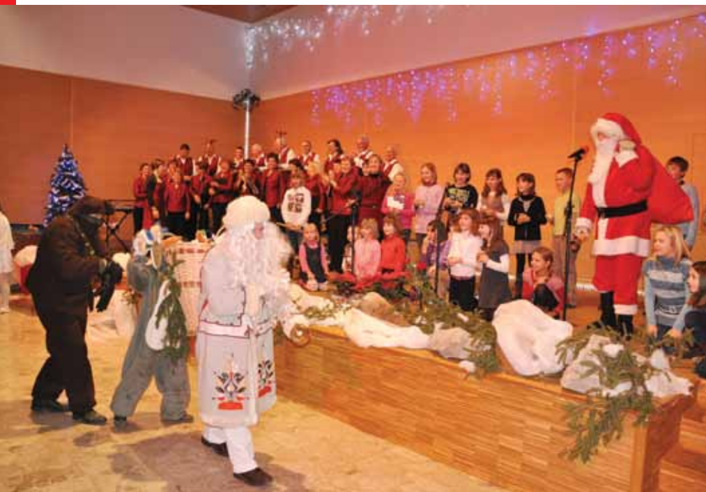
Božičku se je pridružil še Dedek mrz

»Kako malo je potrebno, da se nam v srcu prižge iskrica sreče in zadovoljstva. Ne potrebujemo vreče cekinov in zlatih palač, potrebujemo le toplo besedo, prijazen nasmeh, ljubeznivi pogled, nežen otroških glas in prijateljsko druženje.«