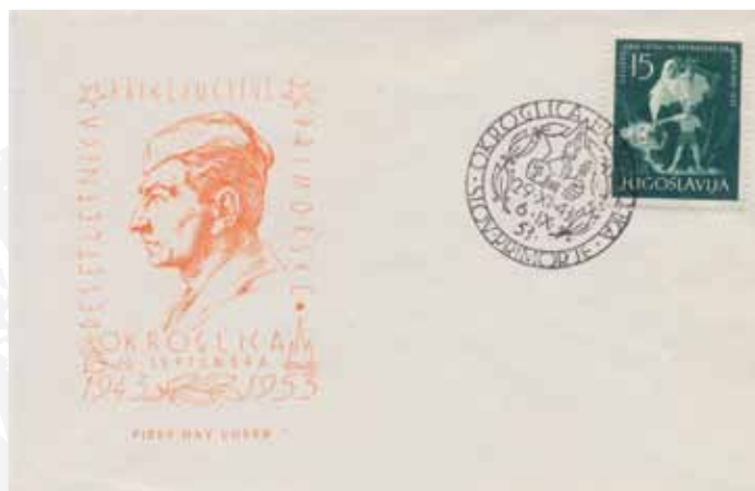
Spominska pisemska ovojnica Okroglica 1953