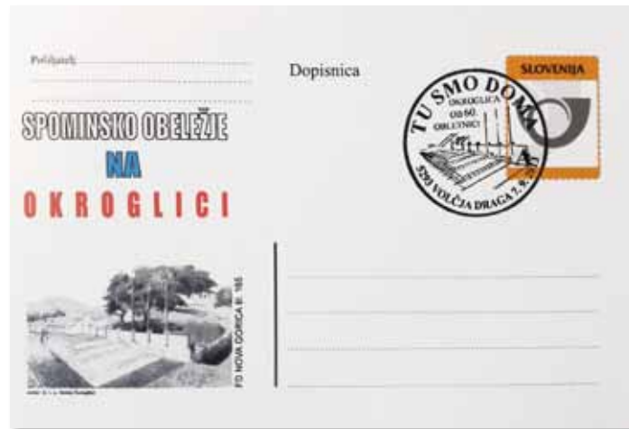
Spominska dopisnica Okroglica 2013