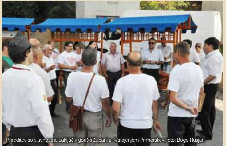
Prireditve so slavnostno zaključili goriški župani z »Vstajenjem Primorske«