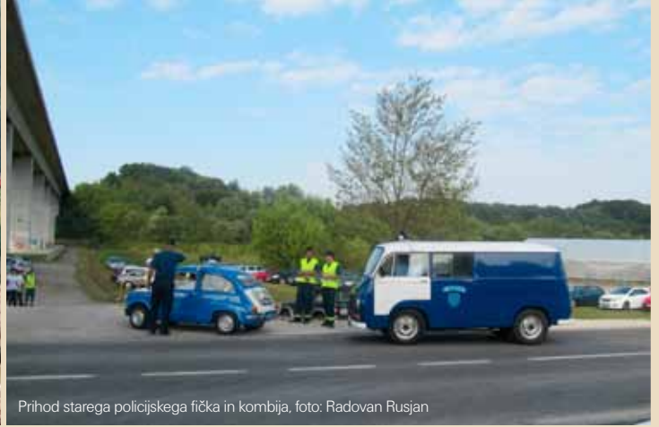
Prihod starega policijskega fička in kombija