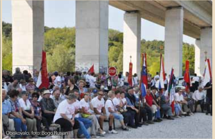
Obiskovalci, foto: Bogo Rusjan