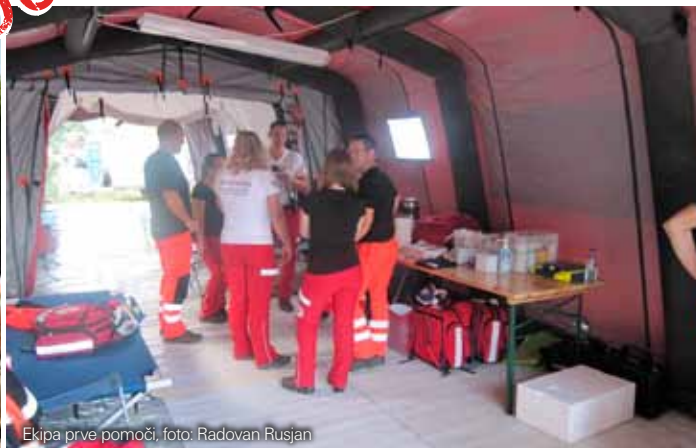
Ekipa prve pomoči, foto: Radovan Rusjan