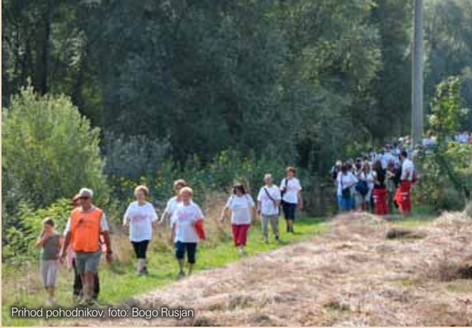
Prihod pohodnikov