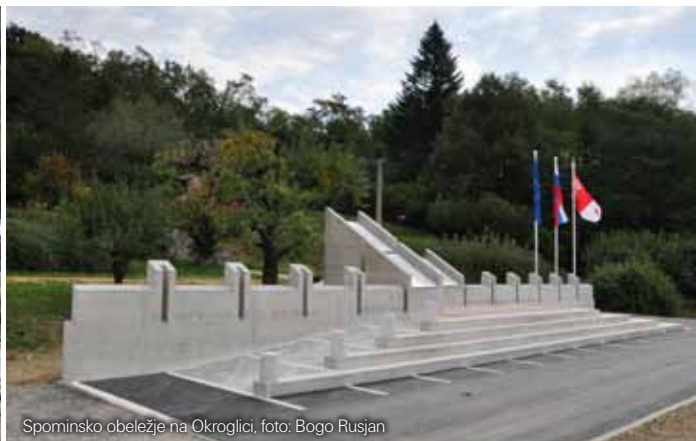
Spominsko obeležje na Okroglici, foto: Bogo Rusjan