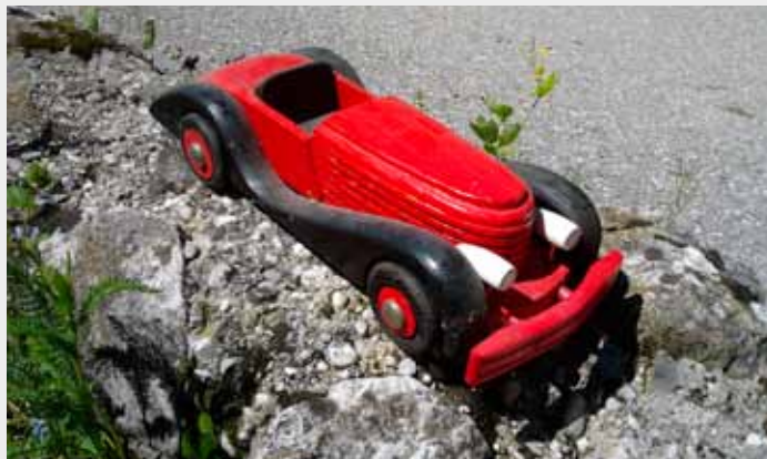
Rdeč avtomobilček

je bil takrat star okoli 4 leta. Spominja se, da je bilo na prizorišču postavljenih tudi veliko »štantov«, na katerih so prodajali različne spominke. Na enem od »štantov« mu je teta Celesta Furlan kupila rdeč lesen avtomobilček, ki ga še danes hrani kot dragocen spomin na Okroglico.