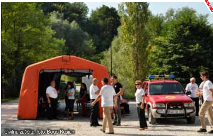
Civilna zaščita, foto: Bogo Rusjan