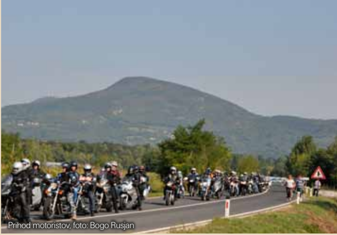
Prihod motoristov