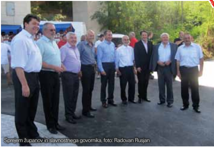
Sprejem županov in slavnostnega govornika