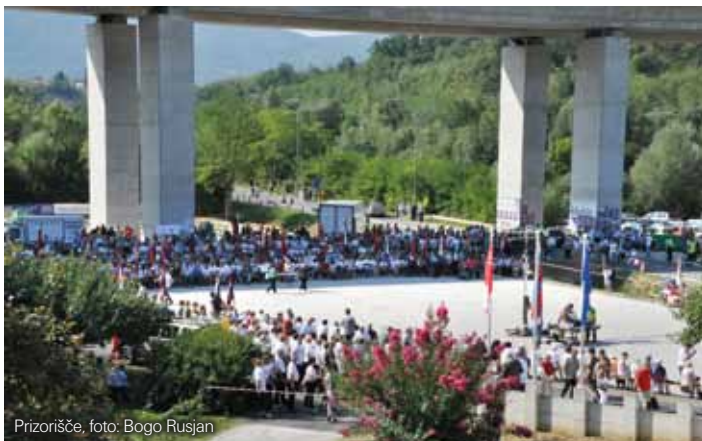
Prizorišče, foto: Bogo Rusjan