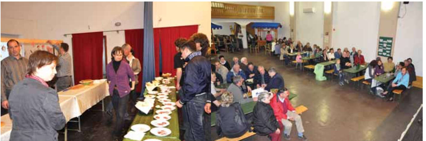
Salami pripravljeni za ocenjevanje