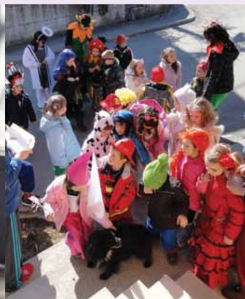
Pustno oblečeni šolarji, otroci iz vrtca in strokovne delavke smo se pokazali vaščanom, ki so nas presenetili s sladkarjami.