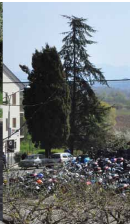
Zbirališče motoristov pred občinsko stavbo

V začetku leta 2007 je med skupino motoristov, ki nas že več let družijo strast do motorjev in dobre družbe, dozorela ideja da ustanovimo svoj moto klub. In tukaj je rezultat naših prizadevanj – novoustanovljen moto klub MOTO COMPANY – kar preprosto pomeni motoristična družba isto mislečih članov z istimi cilji in idejami.