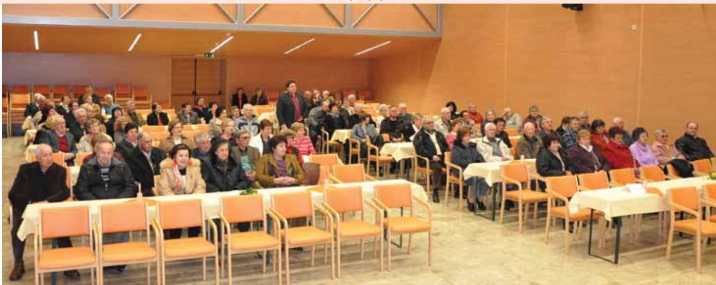
Dobra udeležba članov društva