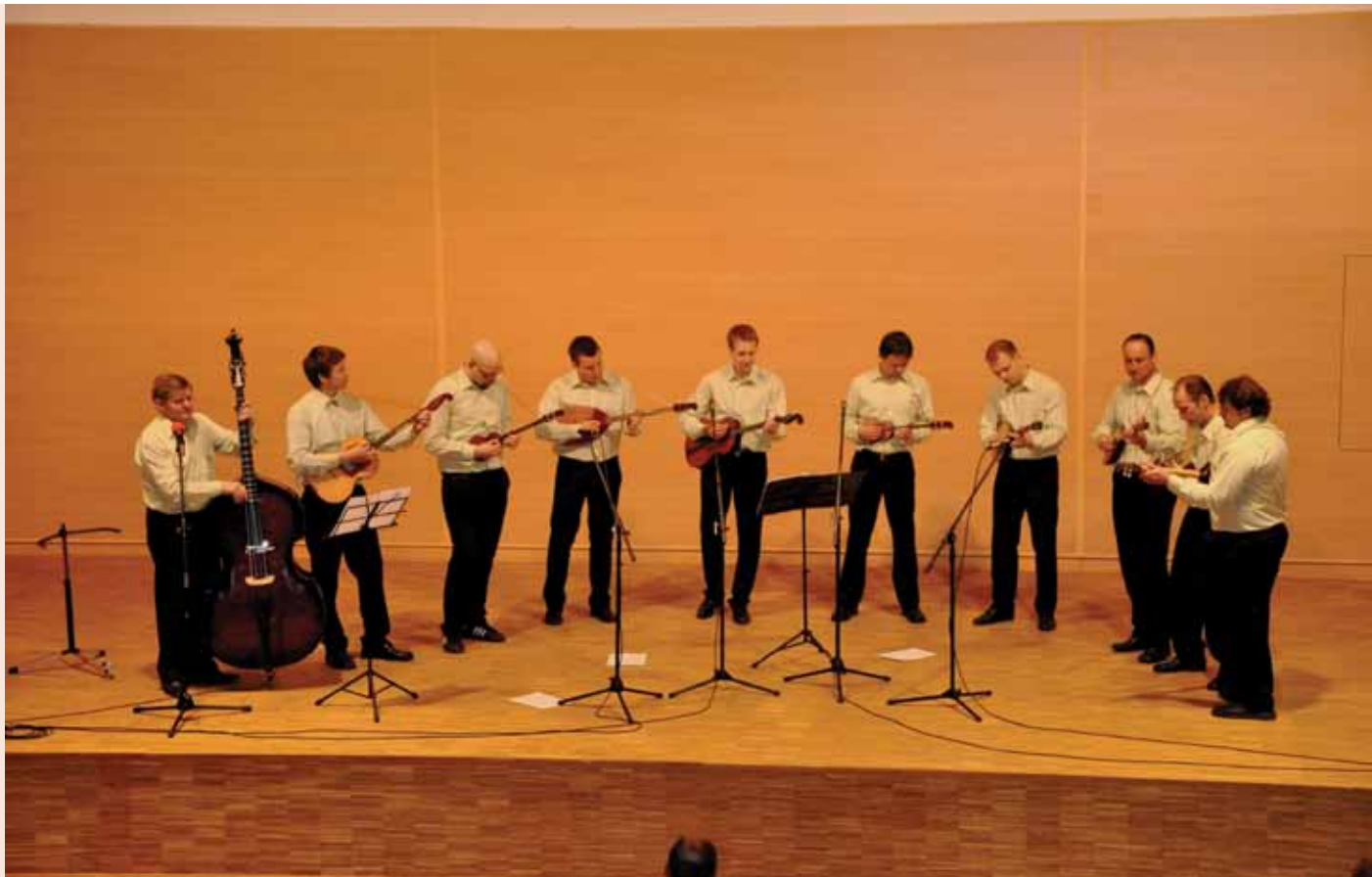
Tamburaši iz Sodražice

Čeprav renško Društvo za kulturo, turizem in razvoj deluje šele dobro leto, je njihova dejavnost zelo pestra in razpotegnjena čez celo leto. 18. marca so izpeljali letni občni zbor, kjer so pregledali opravljeno delo v minulem letu, v katerem je bila med mnogimi zastavljenimi nalogami najbolj odmevna in zahtevna odprtje Gregorčičeve spominske poti.