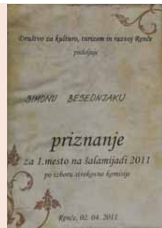
Proizvajalci in nagradenci so prejeli tudi priznanja