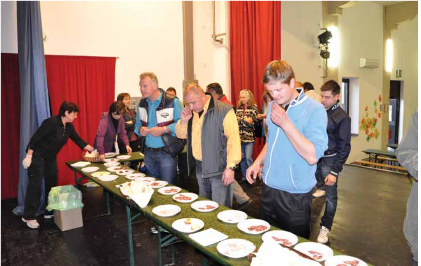
Obiskovalci so zavzeto preverjali kvaliteto salam