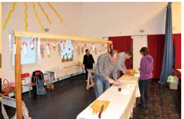
Obiskovalci so kar pridno krajšali razstavljenе vzorce salam