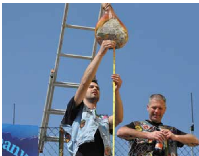
Pršut, kot nagrada za najboljšega ocenjevalca višine nad tlemi

zgodila pri občinski stavbi v kateri so sodelovali policisti prometne uprave iz Nove Gorice in reševalci zdravstvenega doma Nova Gorica. Prikazano je bilo, zelo poučno in koristno pa ne samo za nas motoriste ampak tudi za druge krajanje. V dvorani Zorana Mušiča je potekalo predavanje na temo varne udeležbe v prometu in nekaj o novih predpisih in globah, ki se nam obetajo po 1. juliju letos, ko pride v veljavo nov zakon. Da sta nam obe prireditvi uspeli