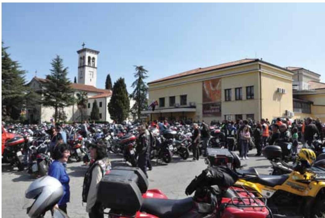
Pestro druženje motoristov