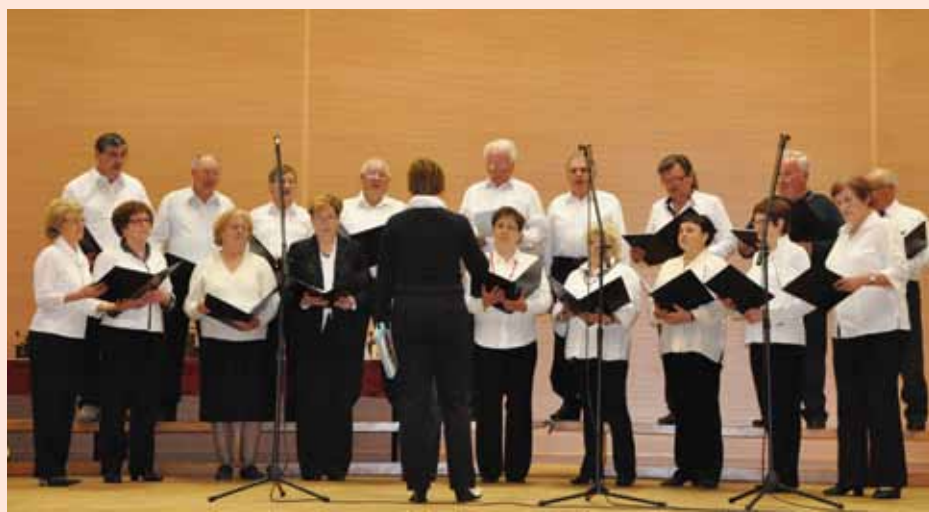
Pevski zbor DU se vedno bolj uveljavlja