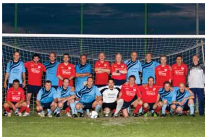
Veterani NK Renče na prijateljski tekmi v Italiji