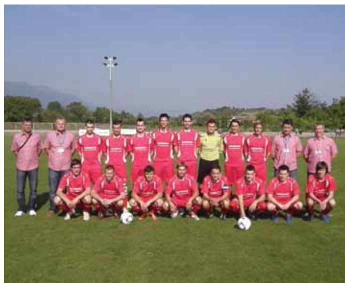
Člani NK Renče