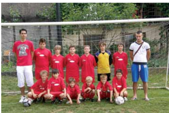
Mlajša selekcija NK Renče