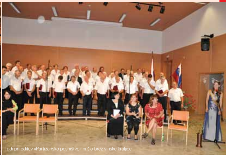
Tudi prireditev »Partizansko pesništvo« ni šlo brez vinske kraljice