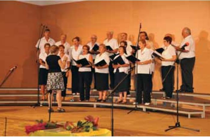
MePZ Klasje Bukovica-Volčja Draga