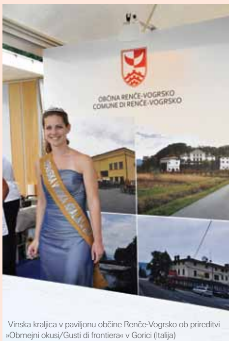
Vinska kraljica v paviljonu občine Renče-Vogrsko ob prireditvi »Obmejni okusi/Gusti di frontiera« v Gorici (Italija)

► predstavitvi kraljičinega vina je zamisel rasla in se razširila – najprej na vse vinarje iz naše občine, nato še na vse pridelovalce hrane. Izjemen občutek je bil, ko se je na povabilo na sestanek odzvalo preko dvajset kmetov, podpora čisto vsakega izmed njih mi je bila pomembna. Zdi se mi, da smo celotna organizacijska ekipa dobili več elana za nadaljnje delo, kar smo nujno potrebovali v zadnjih dveh napornih tednih priprav pred prireditvijo, ki so jih zaznamovali usklajevanje ponudbe, pošiljanje vabil, dogovarjanje na ministrstvu glede obiska kmetijskega ministra mag. Dejana Židana , urejanje dvorane, razmislek okrog vsakega najmanjšega detajla, od vlog nastopajočih do postavitve zadnjega koša za smeti. V takih okoliščinah se zavem, kako pomembna je vsaka komponenta, vsak zanesljiv človek v organizacijski ekipi, vsak pridelovalec, ki je pripravljen s svojim izdelkom sodelovati.