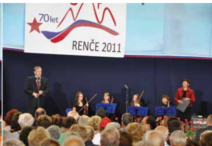
Predsednik države Danilo Türk