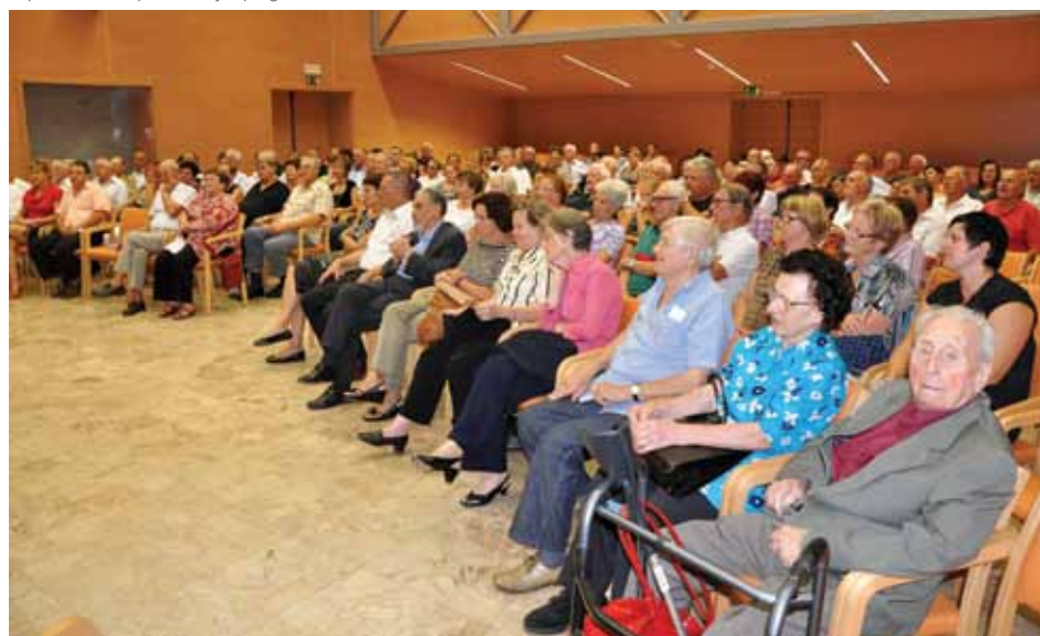
Občinstvo je pozorno poslušalo pesmi poetov in pevskih zborov