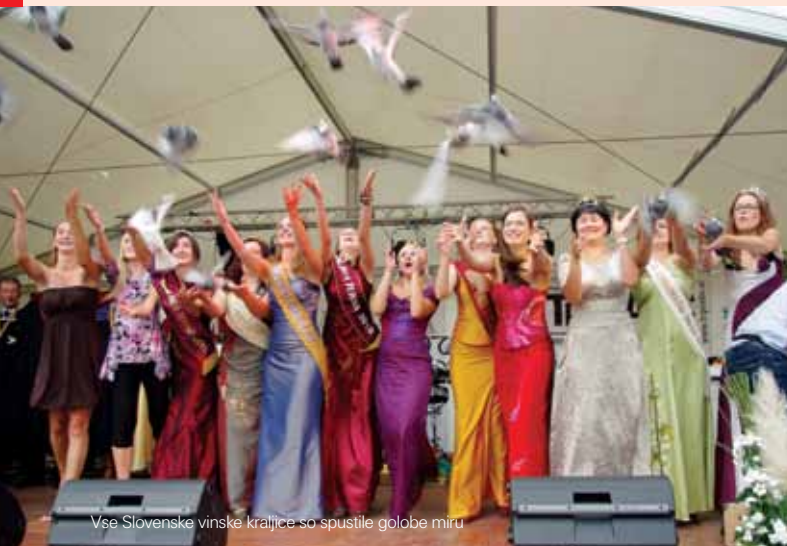
Vse Slovenske vinske kraljice so spustile golobe miru