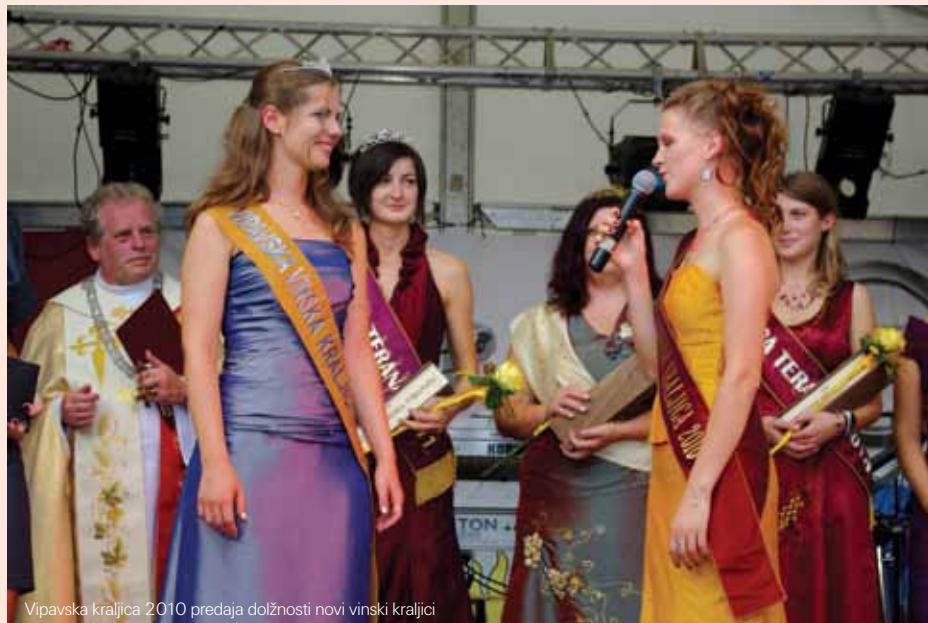
Vipavska kraljica 2010 predaja dolžnosti novi vinski kraljici