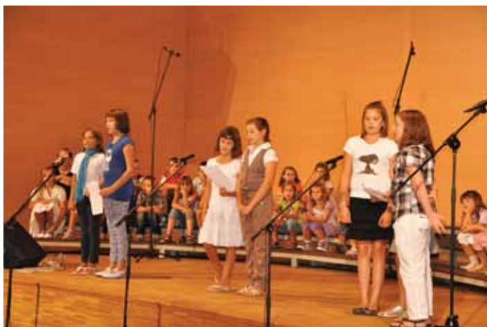
Lep program so pripravili učenci in učenke POŠ Bukovica