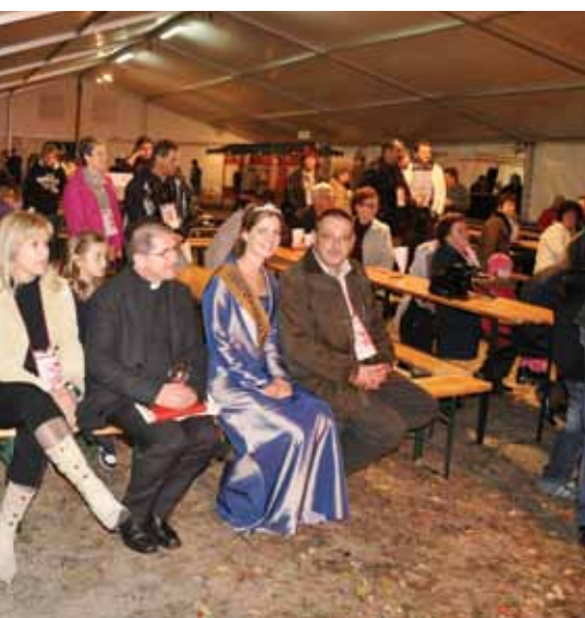
Še predstavniki krajevnih skupnosti Vogrsko, Renče in Bukovice-Volčja Drage