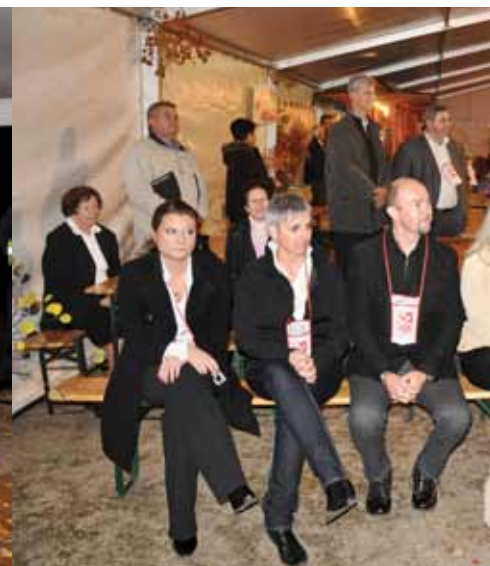
Poleg odgovorne za organizacijo prireditve, so prireditev spremljali ter župnik, vinska kraljica in župan.