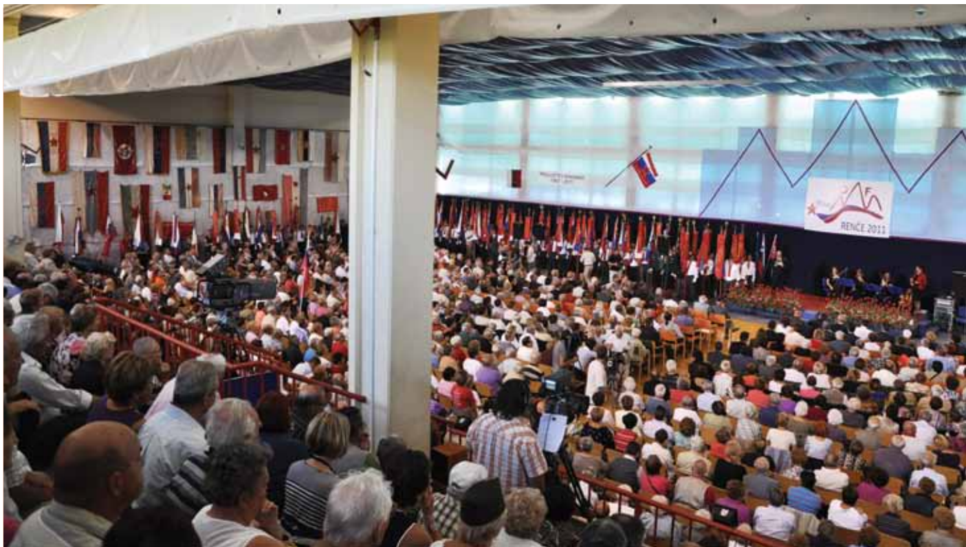
Kotalkališče v Renčah je bilo premajhno, da bi sprejelo vse, ki so želeli prisostvovati prireditvi

► udeležence povabil na druženje ter se zahvalil vsem, ki so pripomogli, da je proslava lepo uspela, od organizacijskega odbora, članov našega občinskega sveta in upravnih orga-