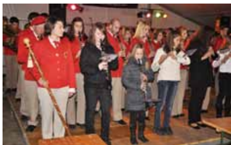
Na prireditvah nikoli ne manjka Pihalni orkester Vogrsko