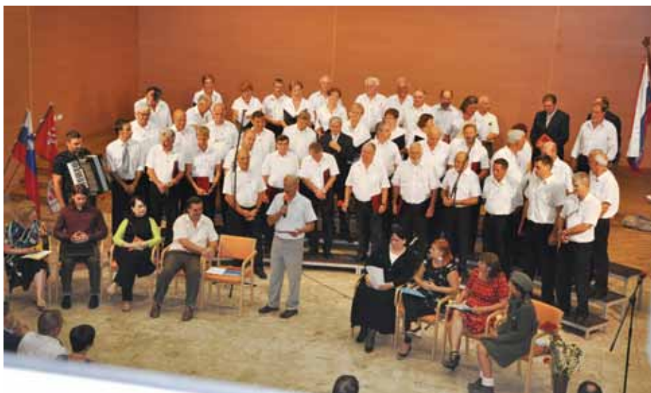
Združeni pevski zbori MoPZ 1883 Lijak Vogrsko, MoPZ Provox in MePZ Klasje Bukovica-Volčja Draga