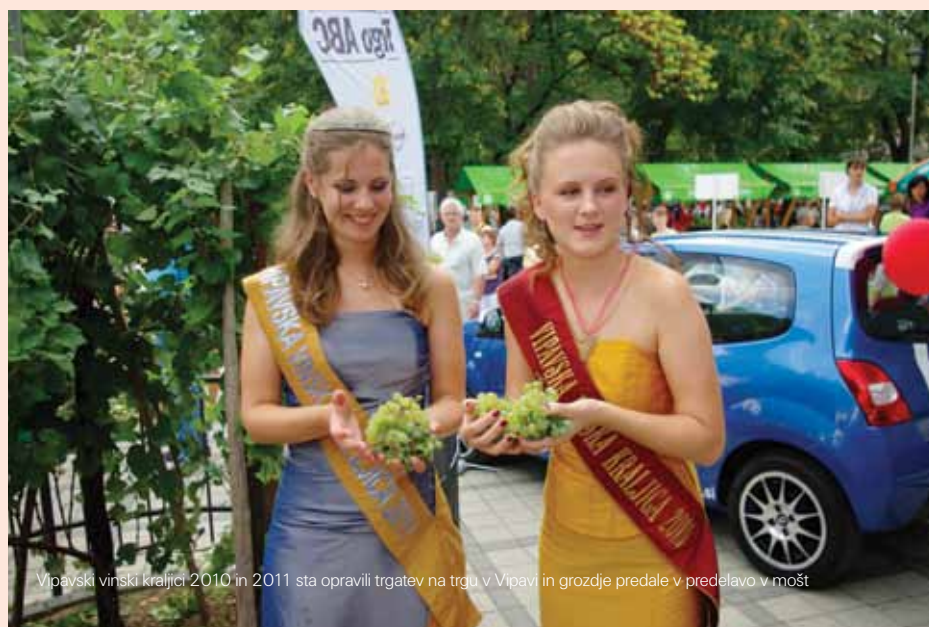
Vipavski vinske kraljice 2010 in 2011 sta opravili trgatve na trgu v Vipavi in grozdje predale v predelavo v mošt