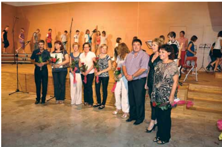
Vodstvo KS se je zahvalilo osebju osnovne šole Renče in POŠ Bukovica

Pozdravljeni krajan KS Bukovica – Volčja Draga. Na koledarju smo obrnili list na september, ko praznujemo praznik KS. Lanski je bil zaznamovan s poplavami.