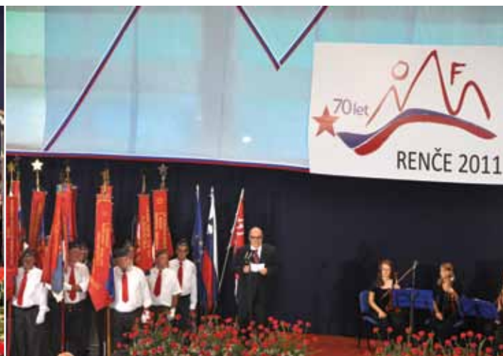
Svoje misli je podal tudi letošnji dobitnik Prešernove nagrade Miroslav Košuta