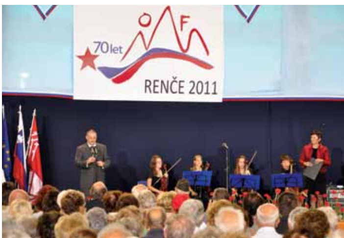
Prisotnim je dobrodošlico izrekel župan občine Renče-Vogrsko Aleš Bucik