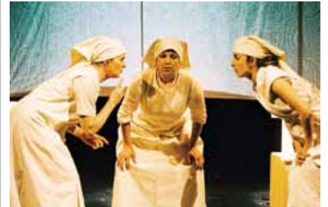
Aleksandrinke - avtor: Marcandrea

Svojo trilogijo si začela z zgodbo o Aleksandrinhah, predstavo, ki je nastala pred šestimi leti. To je bil tvoj prvi avtorski projekt in hkrati edini od treh, kjer se ne podpisuješ tudi kot avtorica teksta. Kako se je začelo, zakaj je prišlo do te predstave?