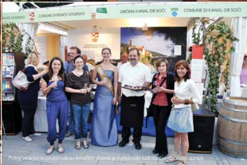
Poleg vinarjev in pridelovalcev kmečkih dobrot je sodelovalo tudi osebje občinske uprave

► predstavitvi kraljičinega vina je zamisel rasla in se razširila – najprej na vse vinarje iz naše občine, nato še na vse pridelovalce hrane. Izjemen občutek je bil, ko se je na povabilo na sestanek odzvalo preko dvajset kmetov, podpora čisto vsakega izmed njih mi je bila pomembna. Zdi se mi, da smo celotna organizacijska ekipa dobili več elana za nadaljnje delo, kar smo nujno potrebovali v zadnjih dveh napornih tednih priprav pred prireditvijo, ki so jih zaznamovali usklajevanje ponudbe, pošiljanje vabil, dogovarjanje na ministrstvu glede obiska kmetijskega ministra mag. Dejana Židana , urejanje dvorane, razmislek okrog vsakega najmanjšega detajla, od vlog nastopajočih do postavitve zadnjega koša za smeti. V takih okoliščinah se zavem, kako pomembna je vsaka komponenta, vsak zanesljiv človek v organizacijski ekipi, vsak pridelovalec, ki je pripravljen s svojim izdelkom sodelovati.