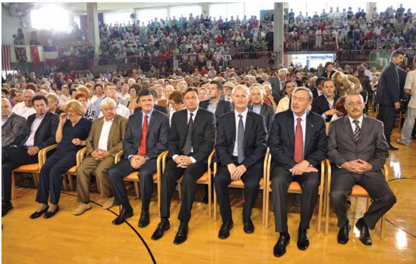
Prireditve se je udeležil državni vrh republike Slovenije