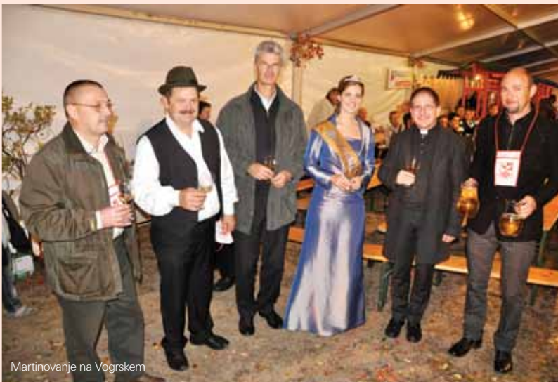
Martinovanje na Vogrskem