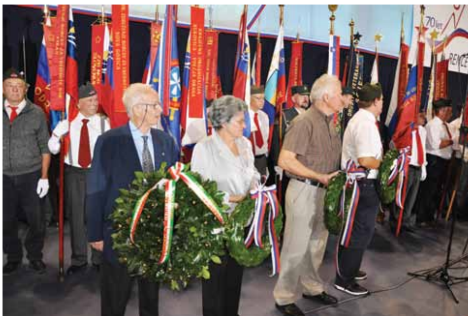
Delegaciji združenja za vrednote NOB in AMPI iz Staranzana sta položili vence na spomenik žrtvam fašističnega nasilja na trgu v Renčah