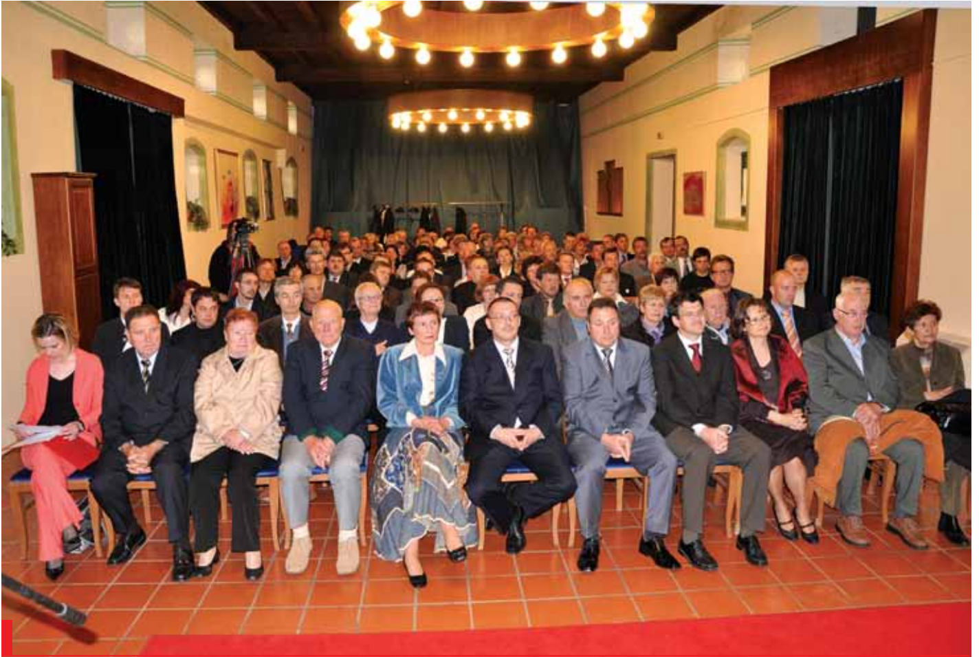
Udeleženci svečane seje

► nje elektronov v atomu, je prejel Zlati znak Jožefa Stefana . Po doktoratu je z raziskavami nadaljeval in eksperimente izvajal skupaj s sodelavci na več evropskih sinhrotronih.