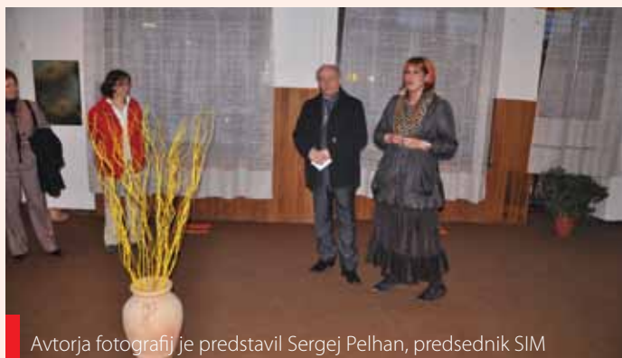
Avtorja fotografij je predstavil Sergej Pelhan, predsednik SIM