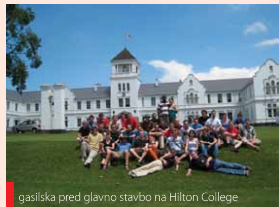
gasilska pred glavno stavbo na Hilton College