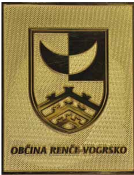
Plaketa Zlati grb občine

Osnovno šolo je obiskoval v Renčah in sicer v slovenskem jeziku in ob tem imel dve uri italijanščine. Bil je eden tistih, ki so slovenščino postavljali na prvo mesto in tudi učenje, saj je ob obveznem osnovnošolskem pouku opravil tudi obrtno šolo. Zaposlen je bil na različnih krajih, saj je moral delati prav vse: nekaj časa v opekarni Sabadello, ki je kmalu zaprla vrata,