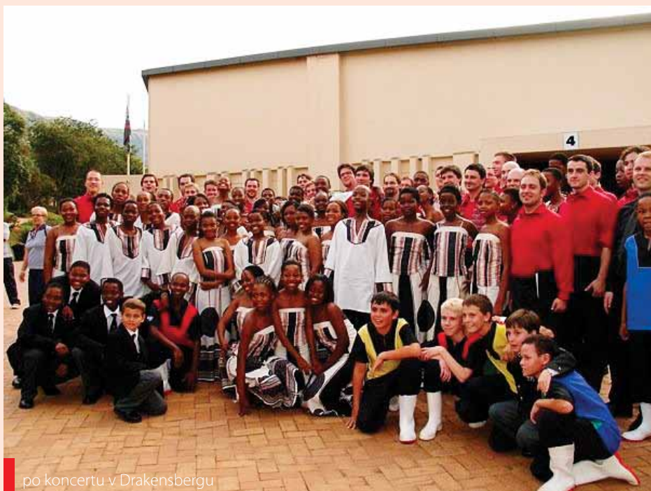
po koncertu v Drakensbergu