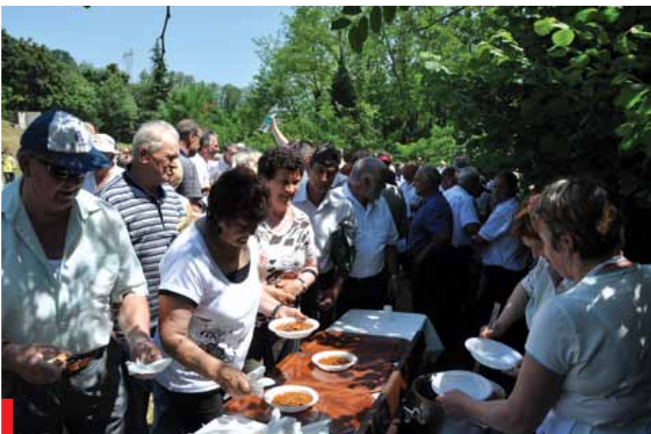
Ob zaključku slovesnosti se je prilegel partizanski golaž