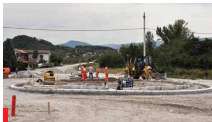
Gradnja krožišča pri obvoznici