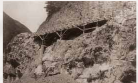
SKUPNOST BORCEV IN SIMPATIZERJEV GORIŠKEGA VOJNEGA PODROČJA

ce, mesnice, kuhinje, pekarnice, ambulante in bolnice. Vendar je bilo vsega premalo za samooskrbo. K sreči mejimo na Furlanijo, ki je lahko priskočila na pomoč potem, ko se je tam razvilo odporniško gibanje. Pri tem moramo posebno zahvalo dati intendanci Montes, ki jo je do svoje mučeniške smrti oktobra 1944 vodil Silvio