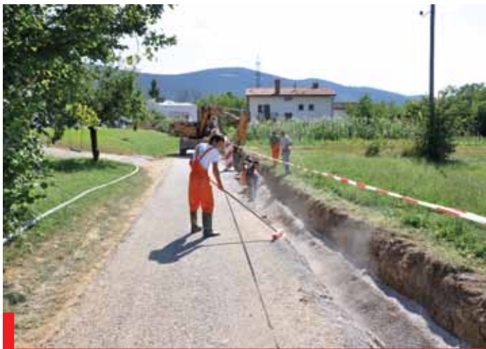
Gradnja vodovoda v Podkrajju