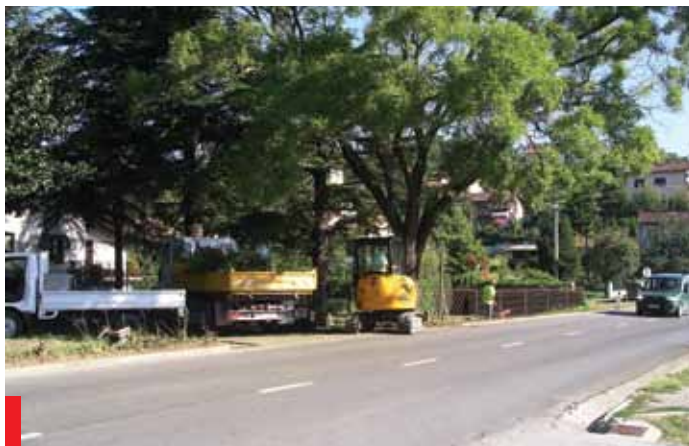
Delavci novoustanovljene službe uspešno urejajo okolico