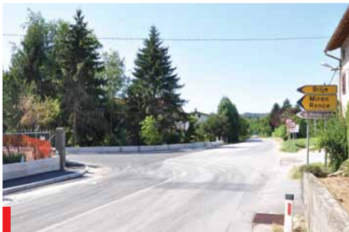
Obnovljeno križišče na Volčja Dragi