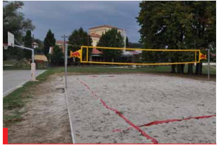
Igrišče za odbojko na mivki v Bukovici, delo Društva Mladi Renče-Vogrsko

Na območju Bukovice in Volčje Drage je bilo preurejeno križišče pri železniškem prehodu, kjer smo uspeli doseči dogovor z lastniki parcel neposredno ob križišču, urejemo parkirišče ob pokopališču v Bukovici, podpisana je pogodba z izvajalcem del pri obnovi kulturnega doma, kjer bomo letos dobili dvorano s 320 sedeži in malo dvorano Zorana Mušiča, spomladi pa uredili garderobe in stopnišča. Vrednost del je ocenjena na okrog 800.000 evrov, pridobljena so tudi sredstva iz evropskih skladov. Projekt se je nekoliko zavlekel, saj je bilo zaradi vrednosti investicije potrebno izvesti javni razpis, kar pa postopek zavleče kar za nekaj mesecev. Predstavljena je bila idejna rešitev glede izgradnje mrliške vežice, v avgustu smo obnovili streho na šoli in vrtcu, zgrajeno je bilo igrišče za odbojko na mivki. Tu pa moram posebej pohvaliti Društvo Mladi Renče-Vogrsko, ki so se pri gradnji zelo angažirali. Nadalje smo