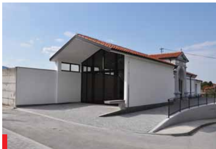
Mrliška vežica na Vogrskem

Na območju Vogrskega smo obnovili vodovod med šolo in sedežem KS, zgradili pločnik med križiščem in cerkvijo, dokončali mrliško vežico, preuredili telovadnico v učilnico za potrebe vrtca. Tu moram povedati, da se je število otrok v šoli in vrtcu povečalo na 40, tako da je bila taka rešitev nujna, zaradi tega pa bodo učence k pouku telesne vzgoje vozili v Vrtojbo. Take razmere pa nas silijo k razmišljanju o trajnejši rešitvi prostorske stiske v šoli in vrtcu na Vogrskem.