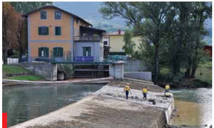
Zaključna dela pri popravilu jezua

Za ustrezno vzdrževanje javnih površin smo zaposlil dva delavca, kar je že vidno z urejevanjem okolice državne ceste skozi Bukovico in okolice spomenika.