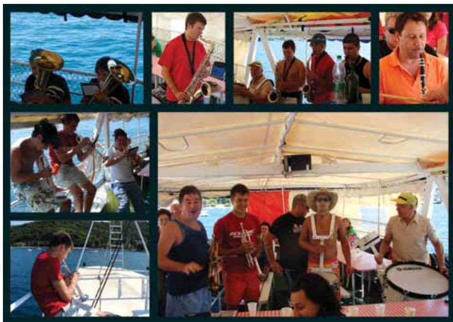
Foto: »enoy the silence«; »Pure music-Pure power«; »your adventure starts here«

Fotografije in besedilo: Mag. Urška Gregorič