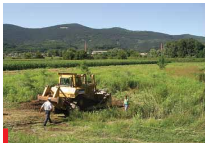
Tako se je začela izgradnja obvoznice

► Gradiščem in Merljaki. Dva odseka sta že zgrajena (1,5 km med Oševljekom in Žigoni ter 1 kilometer med Martinuči in Ozrenjem). Vzporedno z deli pri vodovodu pa smo se uspeli s krajanom dogovoriti o širitvi ceste na teh trasah in ureditvi odvodnjavanj. Upam, da nam bo letos uspelo te ceste prevleči z grobim asfaltom, dokončati pa drugo leto. Upoštevati je treba, da se mora teren vendarle sesesti. Krajanom bi tu izrekel zahvalo za konstruktivno sodelovanje pri pridobivanju zemljišč. Neposreden stik med krajanom in županom omogoča pristno izmenjavo informacij in ljudje to spoštujejo. Rezultat takega načina komuniciranja je med drugim tudi hiter dogovor o ureditvi križišča cest med Žigoni in Merljaki pri „Karavli“. Za krajane Renč bo pomemben tudi podatek, da smo pred kratkim podpisali pogodbo z izvajalcem del pri izgradnji mliške vežice. Tudi tu je prišlo do daljšega roka zaradi javnega razpisa, ki ga narekuje višina naložbe. Naj na koncu omenim še dokončanje del na jezu