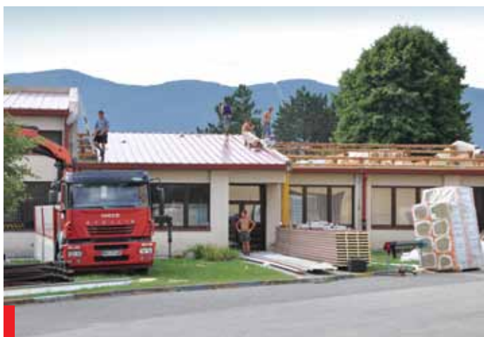
Obnova strehe na vrtcu in šoli v Bukovici

pri Martexu obnovili del vodovoda, v bližnjem novem križišču pa bomo v kratkem uredili razsvetljavo, ki bo izboljšala varnost. Finančno pa smo dokončali enega največjih projektov, to je cesta Vogrsko-Volčja Draga (2,9 milj. evrov), poleg tega pa še vodovod in kanalizacijo na tej trasi. Tudi tu smo uspeli pridobiti sredstva iz državnih in evropskih skladov. Letos predvidevamo asfaltacijo ceste v starem delu Bukovice, kjer pa mora biti še prej vkopana električna napeljava.