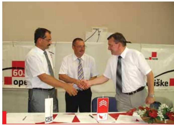
Podpis pogodbe za izgradnjo obvoznice v Renčah

► Gradiščem in Merljaki. Dva odseka sta že zgrajena (1,5 km med Oševljekom in Žigoni ter 1 kilometer med Martinuči in Ozrenjem). Vzporedno z deli pri vodovodu pa smo se uspeli s krajanom dogovoriti o širitvi ceste na teh trasah in ureditvi odvodnjavanj. Upam, da nam bo letos uspelo te ceste prevleči z grobim asfaltom, dokončati pa drugo leto. Upoštevati je treba, da se mora teren vendarle sesesti. Krajanom bi tu izrekel zahvalo za konstruktivno sodelovanje pri pridobivanju zemljišč. Neposreden stik med krajanom in županom omogoča pristno izmenjavo informacij in ljudje to spoštujejo. Rezultat takega načina komuniciranja je med drugim tudi hiter dogovor o ureditvi križišča cest med Žigoni in Merljaki pri „Karavli“. Za krajane Renč bo pomemben tudi podatek, da smo pred kratkim podpisali pogodbo z izvajalcem del pri izgradnji mliške vežice. Tudi tu je prišlo do daljšega roka zaradi javnega razpisa, ki ga narekuje višina naložbe. Naj na koncu omenim še dokončanje del na jezu