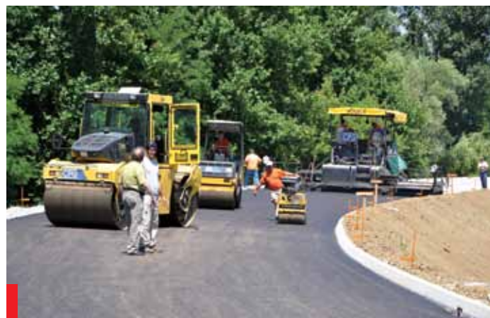
Ob polaganju asfalta v mesecu juniju smo bili vedno bolj prepričani, da bo obvoznica zgrajena do obljubljenega roka

pri mlinu v Renčah, ki je bil precej poškodovan med zadnjimi poplavamami. Kot je iz povedanega razbrati je bilo v letošnjem letu težišče del na območju Renč, prvi dve leti so dela potekala na območju Vogrskega, ob koncu letošnjega leta in drugo leto pa bo težišče v Bukovici. Del vsekakor ne bo zmanjkalo, saj je želja, predvsem pa potreb, veliko.