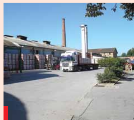
Dvorišče Goriških opekarn