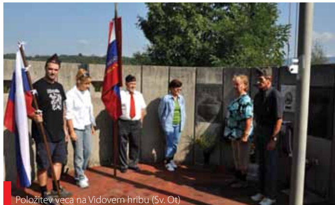
Položitve vece na Vidovem hribu (Sv. Ot)

19. september - nepozaben dan za Bukovico in Volčjo Drago, spomin na požig vasi. Ta dan smo si ga krajani vzeli za svojega - krajevni praznik.