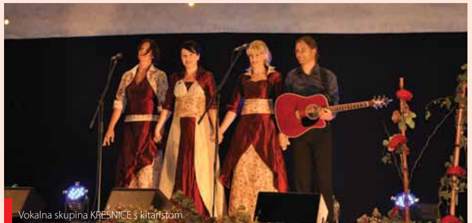
Vokalna skupina KRESNICE s kitaristom

terpretacijo in vrhunskim nastopom. Kakšni glasovi!!!!- smo vzdihovali obiskovalci, domačini in sosede in prav vsi dodatki so bili premalo, da bi rekli: dovolj! Dragi fantje, v Renčah vas bomo prav gotovo še poslušali!