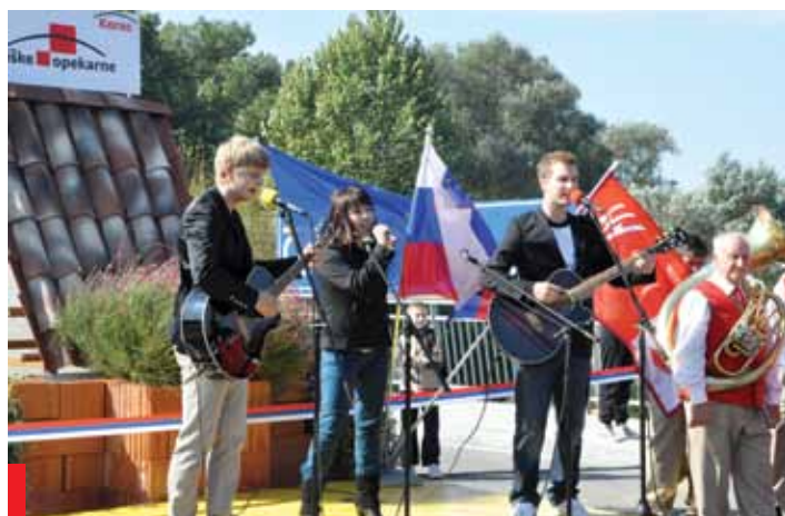
Gradnja krožišča pri obvoznici