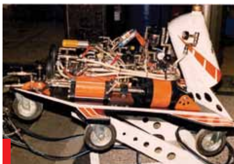
Naprava za vbrizgavanje zaščitnega premaza Global

Za te dosežke je prejel kar nekaj priznanj in celo denarno nagrado 6000 nemških mark. Iz leta 1985 ima priznanje Obrtne zbornice Slovenije, iz leta 1986 pa priznanje Obrtnega združenja Nova Gorica, iz tega časa pa je tudi nagrada, ki jo je prejel na natečaju Sejem domače pameti. Dve leti pozneje je na zboru inovatorjev v Zagrebu prejel kar nekaj priznanj in pohval, predvsem pa