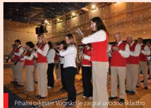
Pihalni orkester Vogrsko je zaigral uvodno skladbo