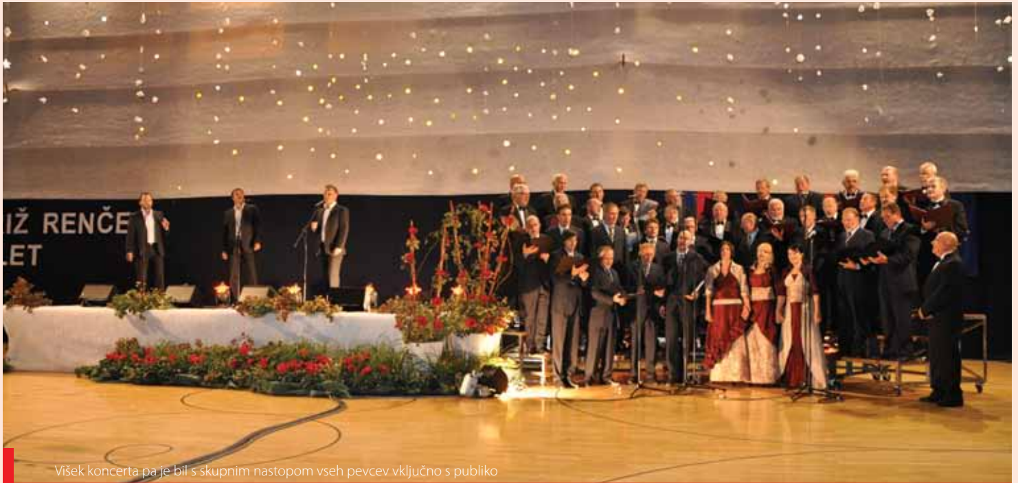
Višek koncerta pa je bil s skupnim nastopom vseh pevcev vključno s publiko

MoPZ PROVOX pa je svoj nastop zaokrožil v vsem svojem interpretacijskem sijaju solistov in zbora.