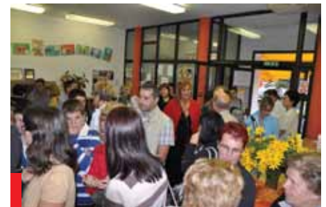
Otvoritev razstave si je ogledalo veliko število krajanov