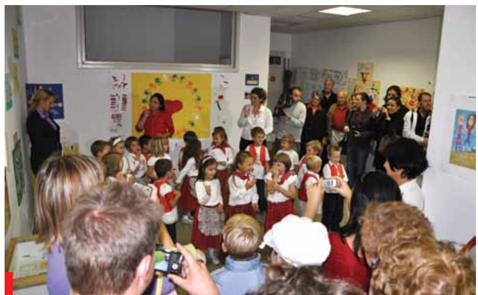
Nastop učencev osnovne šole Lucijana Bratkoviča Bratuša Renče