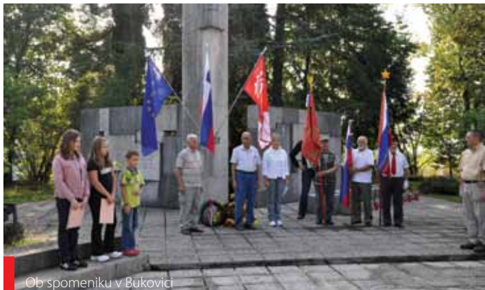
Ob spomeniku v Bukovici