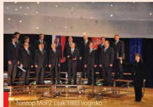
Nastop MoPZ Lijak 1883 Vogrsko