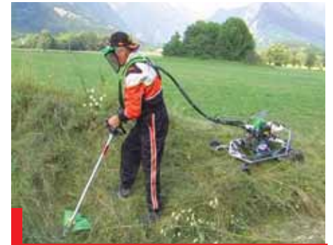
Večnamenska samohodna kosilnica

Prototip te kosilnice ima poleg košnje še funkcije: rezanje žive meje, obrezovanje dreves, obiranje oljk, rahljanje zemlje in čiščenje pločnikov. Ta naprava izpopolnjuje in izboljšuje hrbtno kosilnico in jo hkrati nadgrajuje, saj odpravlja njene negativ-