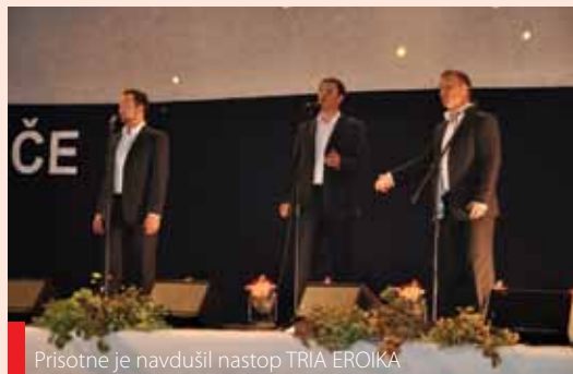
Prisotne je navdušil nastop TRIA EROIKA