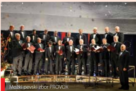
Moški pevski zbor PROVOX