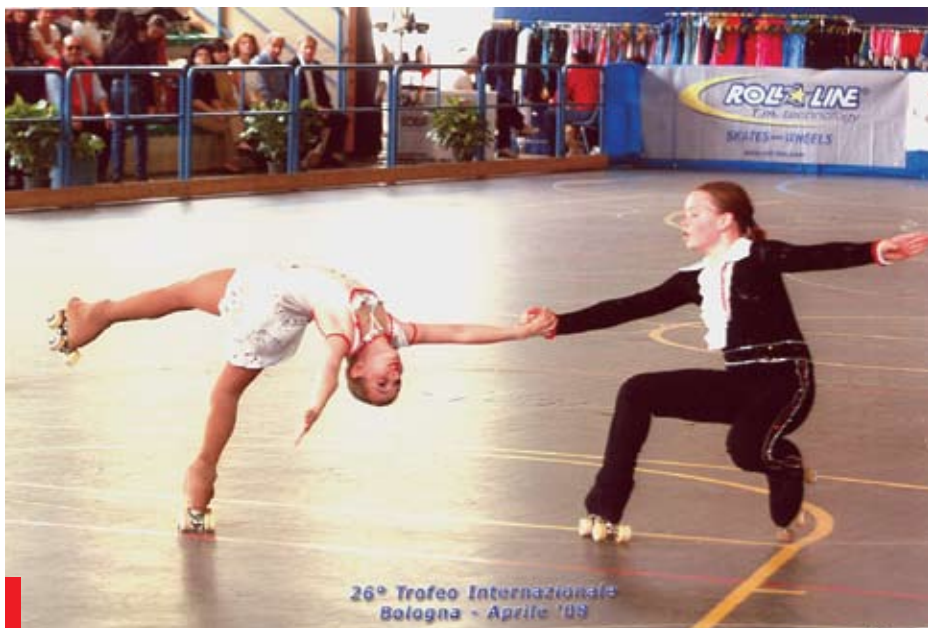
26° Trofeo Internazionale Bologna - Aprile '08