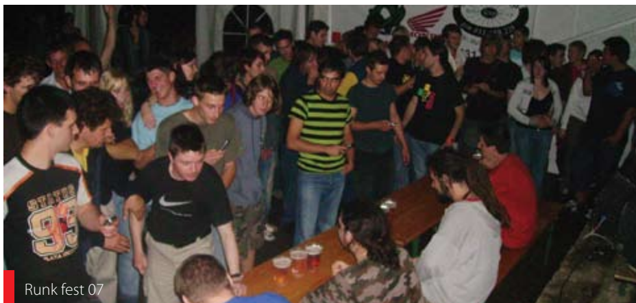
Runk fest 07

Preden se boste, dragi bralci, odpravili na zaslužen dopust in v času, ko boste šolarji zaključevali šolsko leto, se pripeljite na Vogrsko. 20., 21. in 22. junija ponovno pripravljamo tradicionalni vaški praznik, na katerem tokrat ne bo manjkalo glasbe in se bo prav gotovo nekaj našlo tudi za vas!