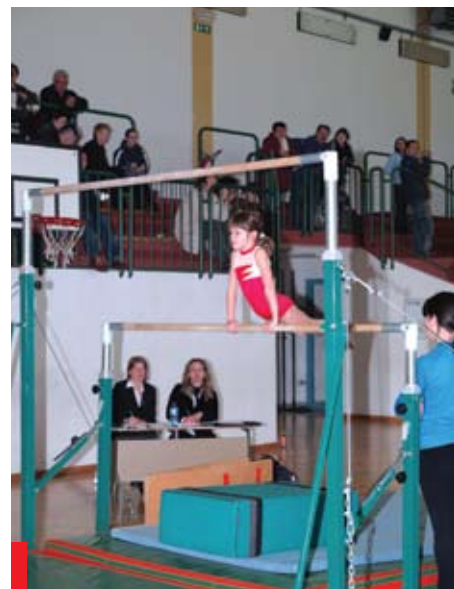
Bradlja - nivojsko