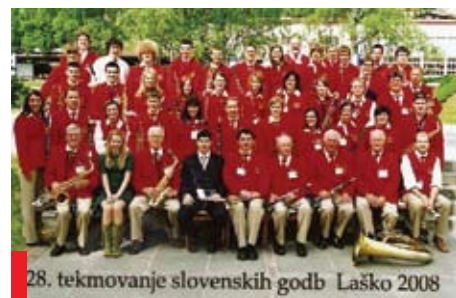
28. tekmovanje slovenskih godb Laško 2008