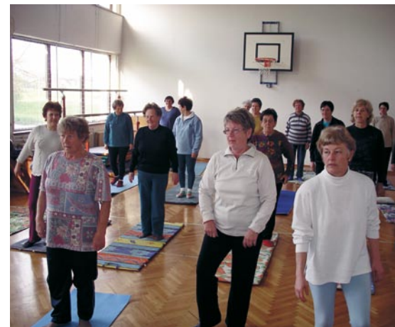
Udeleženske VESELE TELOVADBE