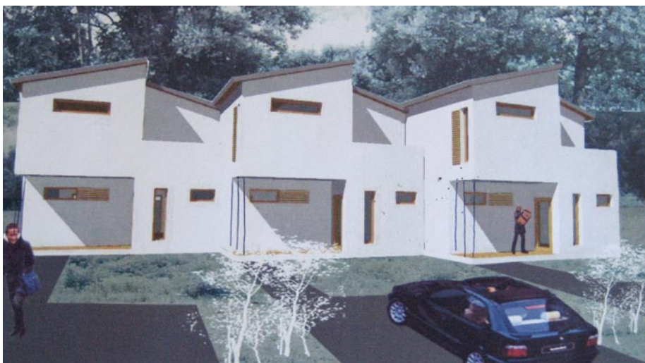
Maketa naselja pri Martinuči