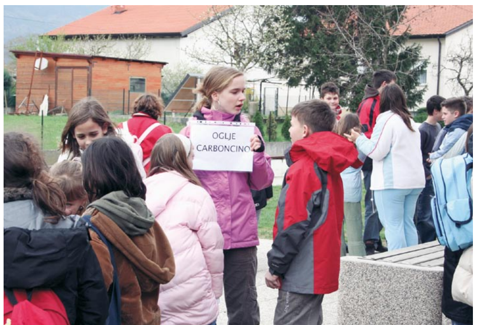
Učenci 4. razreda

Slovo ni bilo težko, saj se bomo ponovno srečali junija v Štarancanu.