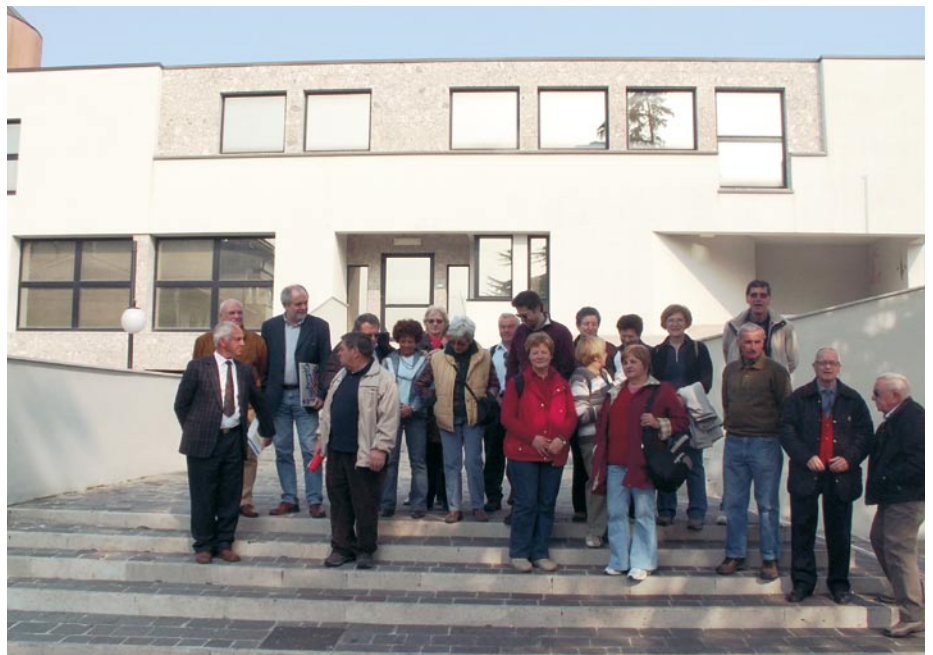
Z gostitelji pred občinsko hišo v Štarancanu

Potem, ko so nam pokazali ulico z imenom VIA RENČE, smo se odpravili do izjemnega naravnega parka, do »IZOLE DELLA CONA«, obširnega mokrišča ob izlivu Soče v Tržaški zaliv. Po