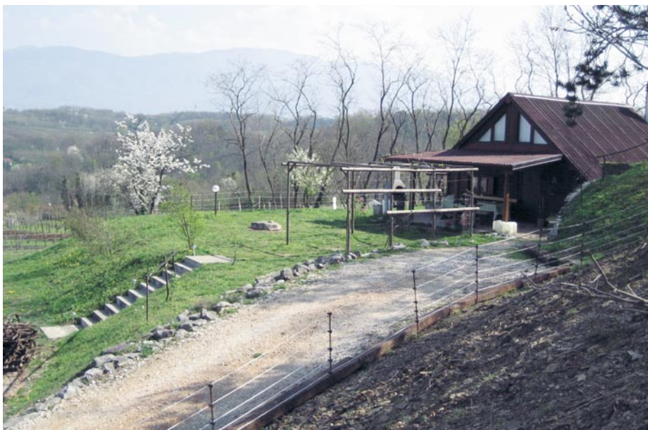
Prvi resni poskusi - vikend