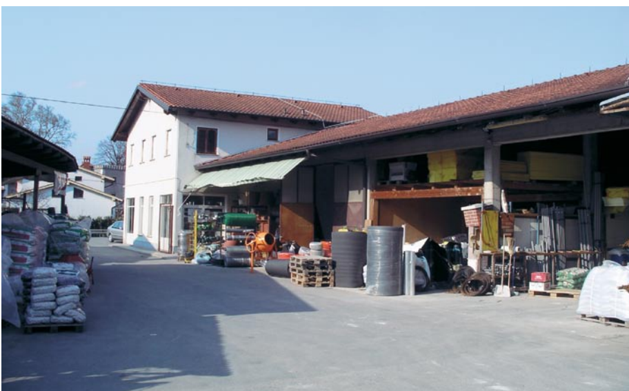
Pred in za trgovino