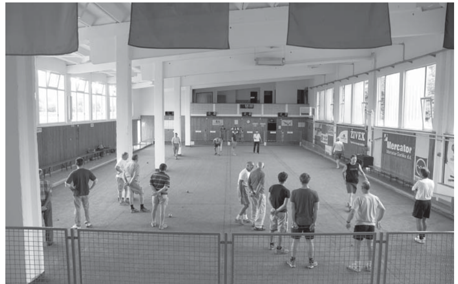
Številni udeleženci balinarske rekreacije v zimskem času

Tudi v teh mesecih se odvijajo rekreativne aktivnosti za ženske in moške in