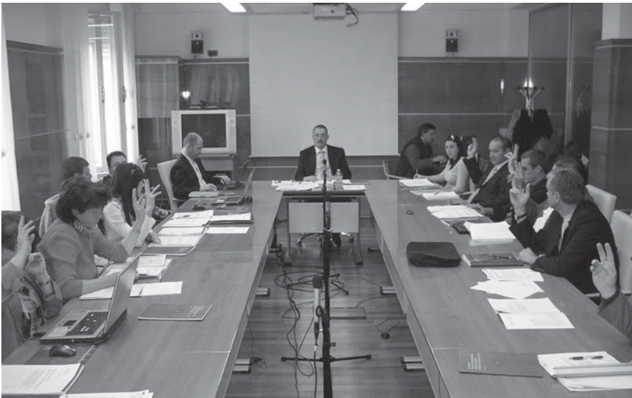
Renče-Vogrsko: Sprejem delitvene bilance, 29. 3. 2007

Vsi postopki za informiranje javnosti so zajeti v statutu in poslovniku, ki smo jih sprejeli na prvih sejah občinskega sveta. Zapisniki sej sveta so javni dokument. To pomeni, da boste lahko o tem, kakšne sklepe sprejemamo, tudi javno obveščeni. Oba dokumenta (statut in poslovnik) ste lahko v celoti prebrali v Občinskem listu.