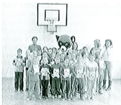
Nagradeno glasilo "Drevo" in obisk Modrega medvedka

in snemanje za TV Primorko. V okviru praznika smo 1. novembra pripravili komemoracijo pri spomeniku in z pesmijo in recitacijami počastili spomin na mrtve. December je bil tudi na naši šoli pravljinski mesec. Posebno obliko pouka smo skupaj s sovrstniki iz Renč preživeli v soboto 16. decembra. Vsak razred se je s svojo točko predstavil občinstvu, obiskal pa nas je tudi Dedek Mraz in nas seveda obdaril. Decembra smo s tematskim glasilom »Drevo« sodelovali tudi na natečaju revije Ciciban za najlepše glasilo. Tudi tu smo bili nagradjeni in tako nas je obiskal Modri medvedek ter sodelujoče obdaril s knjižnimi nagradami. Ob kulturnem prazniku smo z različnimi pevskimi in recitacijskimi točkami popestrili prireditev v kulturni dvorani v Renčah. Polni novih vtisov in doživetij so se naši četrtošolci vrnili iz petdnevne šole v naravi, ki so jo letos preživeli v Medvedjem Brdu.