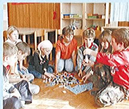
... in nagrada (lego kocke)