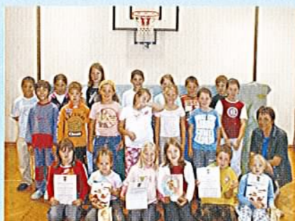
Nagrajena knjiga "Otrok odprtih rok"...