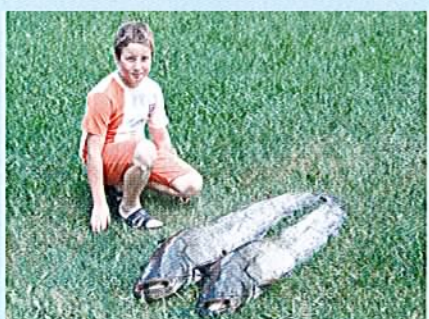
Nik po tekmovanju "Nočni lov na soma"