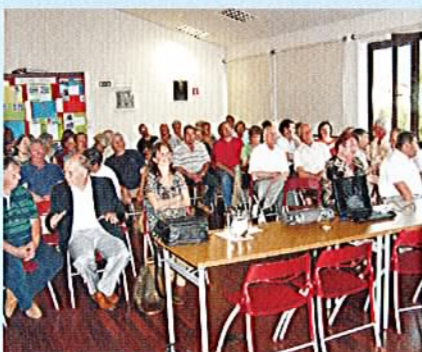
Prijetno vzdušje ...