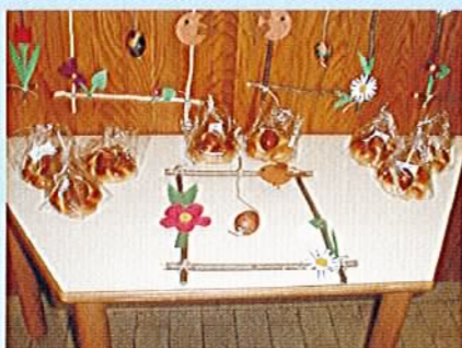
Velikonočna gnezdeca in okvirji