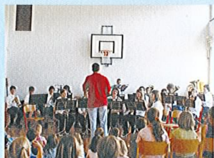
Obisk Pihalnega orkestra Vogrsko