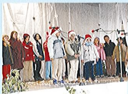
Nastop na novoletni prireditvi v Renčah