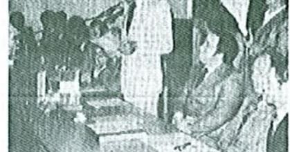
Krajevna skupnost Renče je v nedeljo na slavnostni seji potrdila pobratenje z italijansko občino Staranzano. Sodelovanje med obema krajevna bo v prihodnje potekalo predvsem na športnem in kulturnem področju.

Slovesnost ob podpisu se je nadaljevala z bogatim kulturnim programom, ki sta ga ponudili obe strani. Skoro tisoč prebivalcev Staranzano je sklenilo besedno poznanost z domstvi, ki so se na moč potukali in se pokazali kot dobri gostitelji. Praznično zvezata stikov med ljudmi zgoraj, da bodo tukaj v prvi steniševki tako, za kar so se dogovorili.