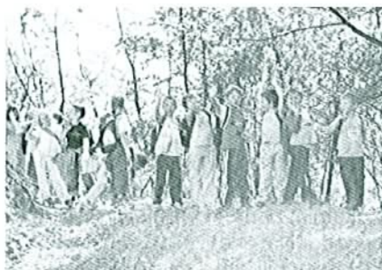
Pohod na sveti Ot

* Ostale fotografije na ta članek si lahko ogledate v fotogaleriji